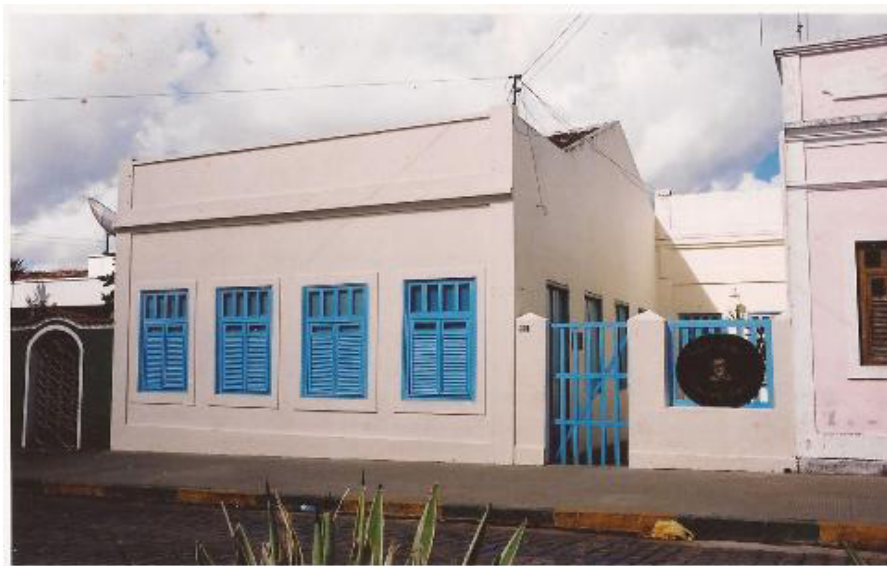
Figura 2 – Fachada da Casa Museu Graciliano Ramos

Em decorrência de sua vida política e cultural, sua casa passou pelo processo de tombamento como patrimônio histórico para preservação de sua memória. Diante dos conflitos para demolição da casa, a prefeitura municipal passou em 1963 a proteger o imóvel.