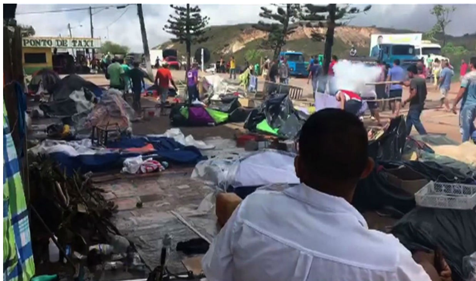
Figura Número 4