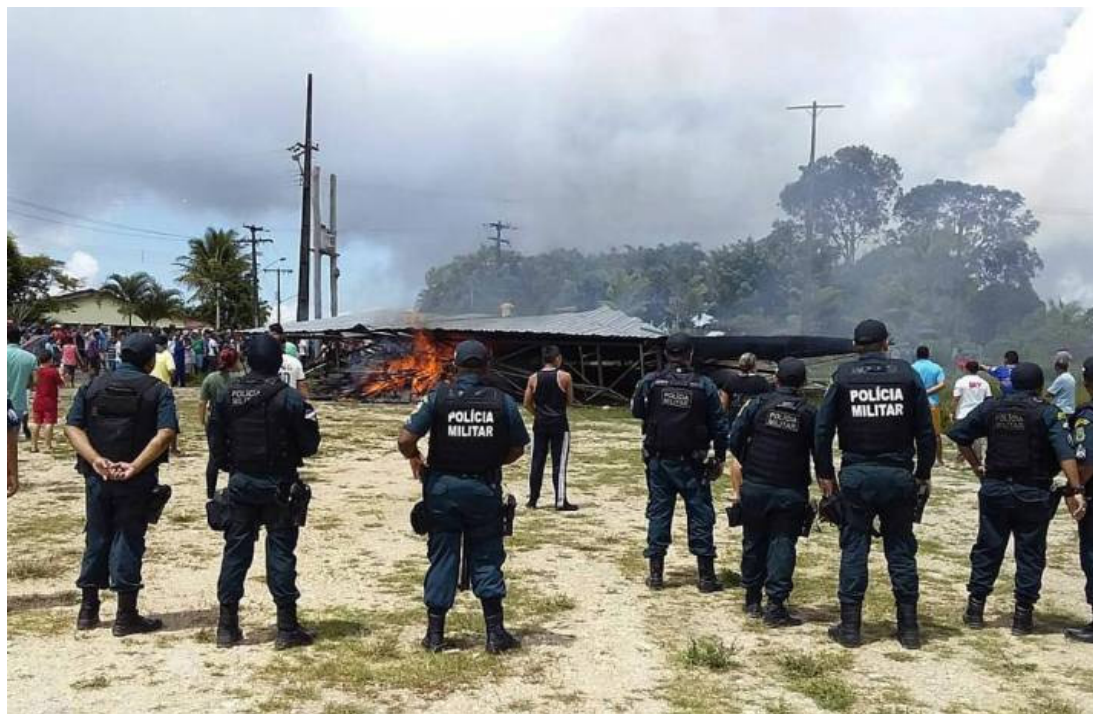
Figura Número 5

población. En algunos momentos el gobierno de Brasil ha tenido que trasladar funcionarios de diversos Estados capitales para la zona fronteriza, en específico a la población de Pacaraima (Vanguardia, 2018).