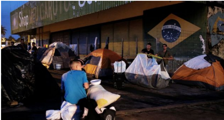
Figura Número 3