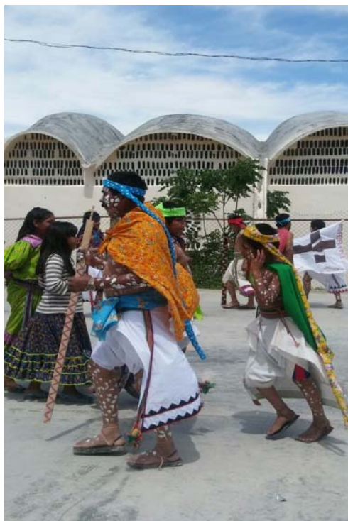
Pobladores del asentamiento rarámuri de ciudad Juárez, Chihuahua, bailando durante las fiestas de Semana Santa de 2016.

Esta motivación por reproducir prácticas rituales en un escenario diverso y contrastante, en el que la eficacia performativa de la danza no tiene una vinculación estricta con la llegada oportuna de las lluvias ni con la siembra y cultivo del maíz, revela un deliberado esfuerzo de persistencia cultural que trasciende por mucho el contexto ecológico en el que se reproduce, subordinándolo al repertorio simbólico ancestral.