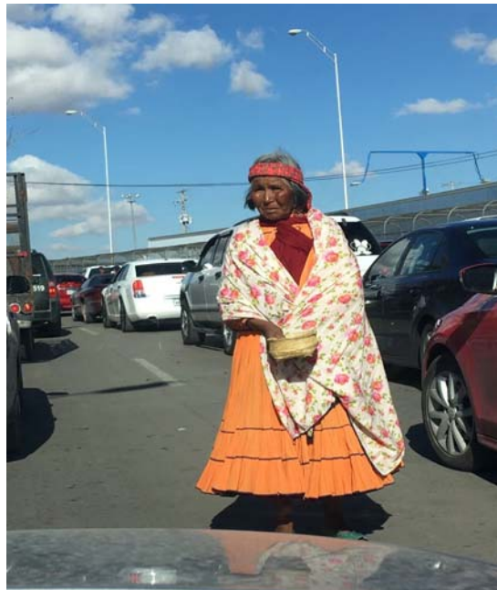
Migración y presencia rarámuri en la frontera juarense. Marzo de 2018

propició que años después, durante la década de los 90 del siglo pasado, tras múltiples gestiones, se fundara el asentamiento rarámuri denominado Colonia Tarahumara, ubicado al norponiente de la ciudad.