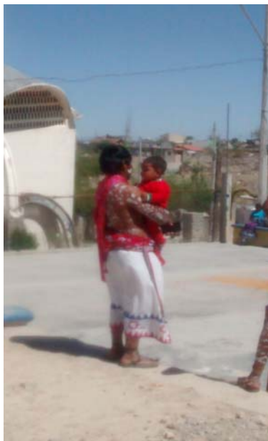
Persistencia étnica en ámbitos urbanos Semana Santa de 2016

pobladores, hasta ser identificado como un “chabochi”; situación ésta completamente homologable a la que se reproduce en los ámbitos serranos.