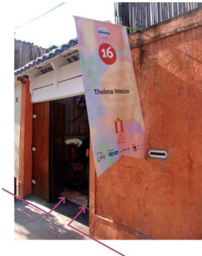
Figura 12. Arte de Portas Abertas, Santa Teresa, Río de Janeiro, 4 de septiembre de 2010

Esta estrategia de apertura de talleres se expandió a diferentes contextos, con otras denominaciones. El Circuito das Artes do Jardim Botânico es un recorrido en el que desde el año 2009, cerca de cincuenta talleres y estudios de arte abren sus puertas a los visitantes en dos fines de semana consecutivos. Otra rama es el Projeto Mauá (2002), en Morro da Conceição, centro de la ciudad, importante circuito para la revitalización urbana y cultural local, que atrae la atención sobre un área desconocida para muchos cariocas. El movimiento temporal, dentro y fuera de los estudios, crea una atmósfera de intimidad y vitalidad en el lugar. Al igual que en eventos anteriores, también representa la expansión del espacio público hacia el interior de los edificios, ampliando el dominio público del barrio y colectivizando la ciudad, aunque sea solo por pocas horas (figura 13).