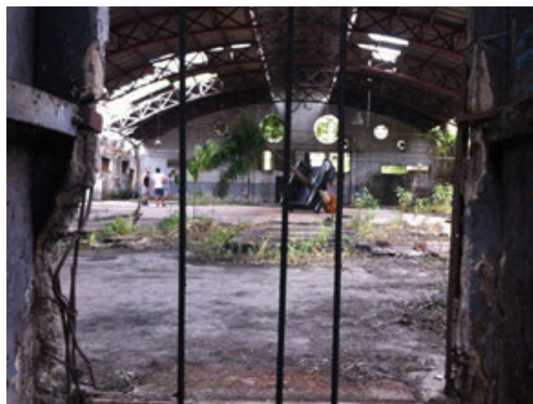
Figuras 14 y 15. Hotel Sete de Setembro y Estamparia Metalúrgica Victoria Flamengo y Benfca, Río de Janeiro, enero de 2015