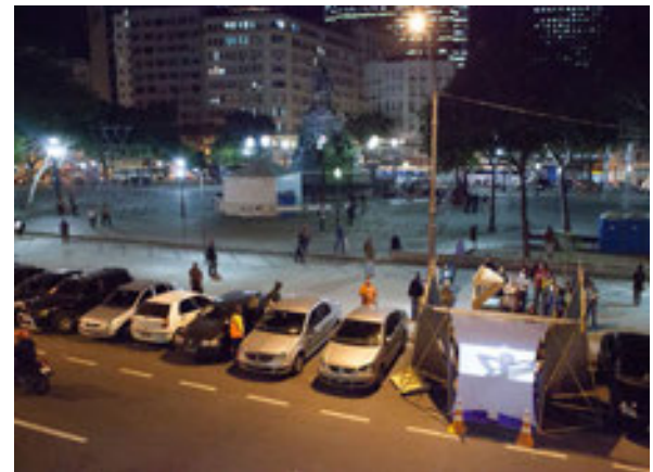
Figura 4. CineVaga Praça Tiradentes, Rio de Janeiro, 21 de septiembre de 2012