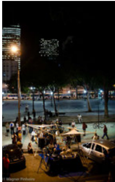
Figura 3. Debate na Vaga, Praça Tiradentes, Rio de Janeiro, 16 de septiembre de 2011