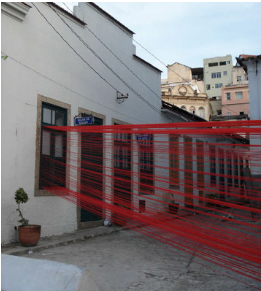
← Figura 13. Projeto Mauá, Igreja de São Francisco da Prainha, Morro da Conceição, Río de Janeiro, diciembre de 2007

De forma distinta a los proyectos de apertura de talleres, que fomentan la rehabilitación de los barrios, pero que operan en contextos de