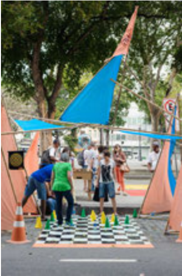
Figura 5. Joga na Vaga! Praça Tiradentes, Rio de Janeiro, 19 de septiembre de 2014