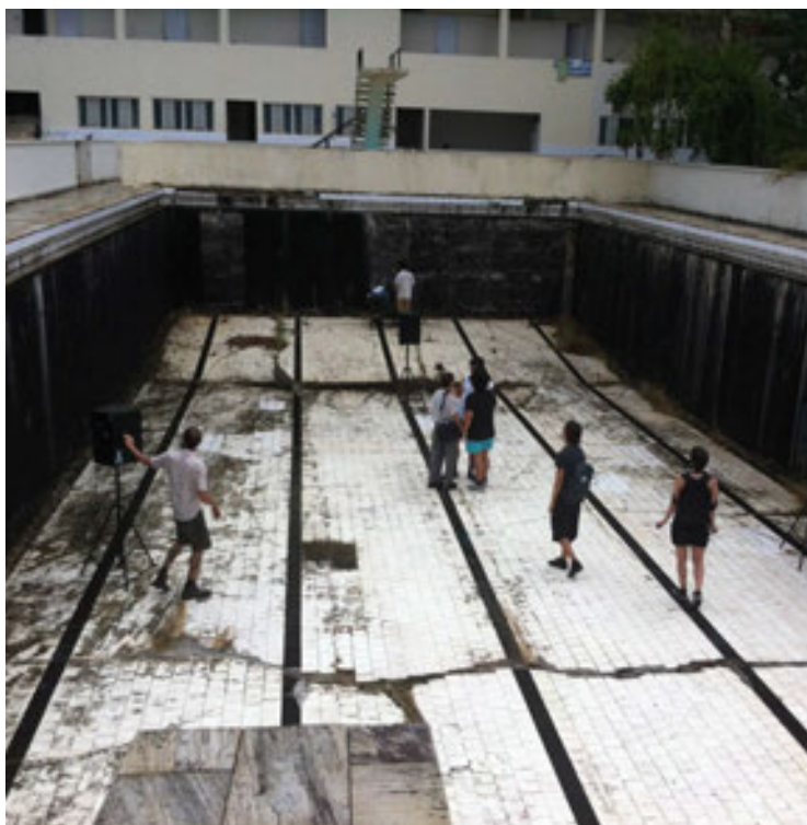
Figura 16. Piscina do Raposo, Edifício Raposo Lopes, Santa Teresa, Río de Janeiro, enero de 2015

Las acciones analizadas potencian los dominios de los peatones, invitándolos a la deriva, a intercambiar experiencias, a conocer lugares antes cerrados, a dislocar los usos de los espacios públicos convencionales y a conocer dominios privados, creando espacios colectivos, aunque efímeros. Dislocando situaciones privadas, domésticas o íntimas, como el auditorio, sala de cine, sala de juegos, lectura, pista de baile, cocina, ducha y dormitorio, hacia el espacio público; o abriendo interiores privados al deambular artístico y la curiosidad del público, las intervenciones temporales tensionan lo público y lo privado y, confirmando nuestra hipótesis, los espacios colectivos comienzan a emerger en áreas tradicionalmente consideradas como públicas y privadas. Además, se estimulan más transformaciones de carácter duradero: mientras que las intervenciones de mayor edad aportan para la revitalización de barrios y espacios públicos (caso de Arte de Portas Abertas y Parede Gentil ), y las intervenciones frecuentes han contribuido al desarrollo de nuevas políticas públicas ( Park(ing) Day ), las más recientes comienzan a asentarse y son promesas de nuevas transformaciones ( Permanências e Destruições ). Algo común a todos ellos es permitir que lo efímero se convierta en parte de la memoria colectiva de la ciudad.