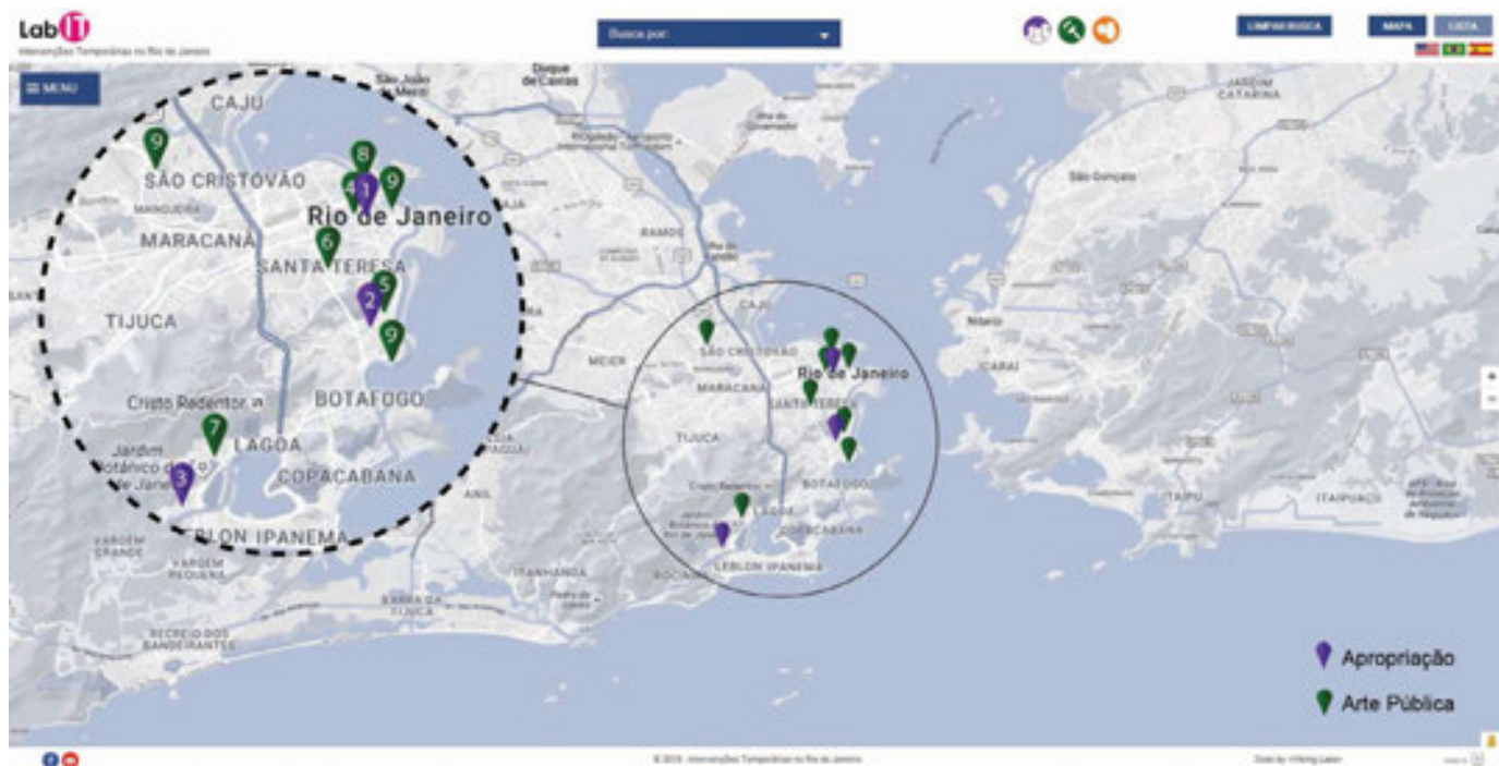
Figura 1. Cartografía de lo temporal en Río de Janeiro presentando las intervenciones discutidas en ese artículo