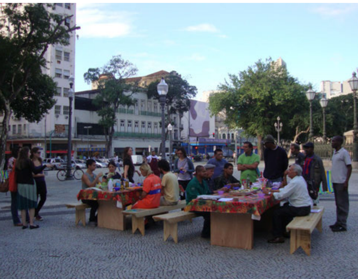
Figura 7. OPAVIVARÁ! ao vivo en Praça Tiradentes, Praça Tiradentes, Río de Janeiro 19 de maio de 2012

La intervención Chuvaverão (Opavivará, 2014), realizada por el mismo colectivo Opavivará, consistió en duchas públicas reales instaladas en la misma medianera, que invitaron a los transeúntes