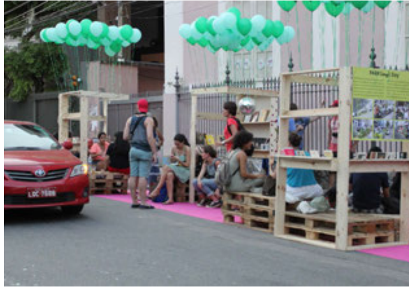
Figura 6. Estação Árvore, Rua Esteves Júnior, Rio de Janeiro, 18 de septiembre de 2015

que potenció un espacio público infrautilizado y “privatizado” (una plaza de coche que podría servir a solo una persona por dos horas), convirtiéndolo en un espacio colectivo, subvirtió el uso de la calle a través de una gradación de usos que cuestionaron los límites entre lo público y lo privado.