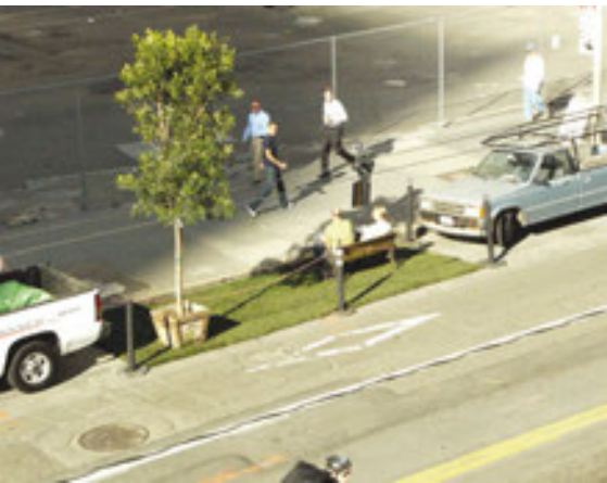
Figura 2. Park(ing) Day San Francisco, 1st and Mission Streets, 16 de noviembre de 2005