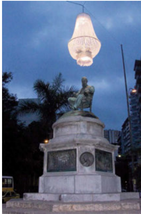
Figura 11. Ilustre Praça José de Alencar, Catete, Río de Janeiro, 24 de octubre de 2008

Acciones culturales en edificios abandonados o de propiedad privada son el otro aspecto de la disolución de los dominios. Han sido muy comunes como maneras de recuperar edificios abandonados, estructuras obsoletas que resultan de la desindustrialización o del vaciado de los centros,