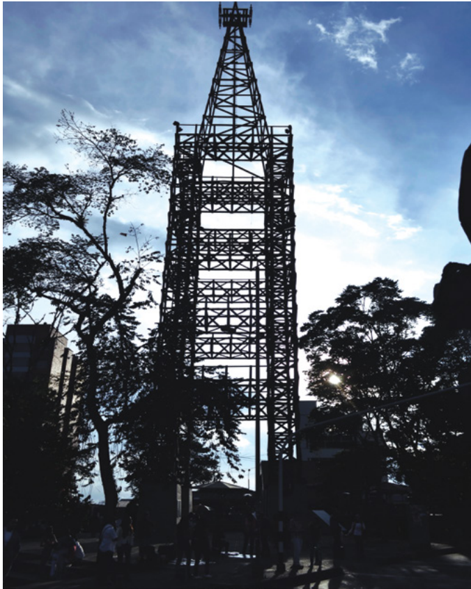
Figura 4. La torre del cable. (el antiguo jardín botánico), según dice el escultor y profesor Alberto Reyes (2016):