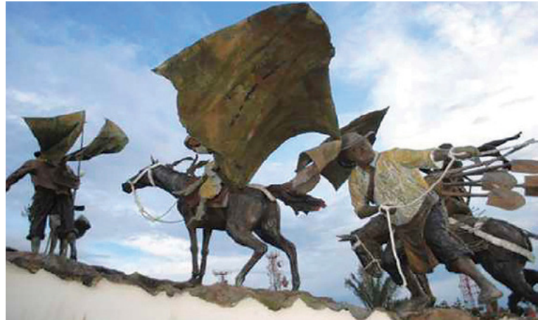
Figura 2. Monumento a los colonizadores: "La Agonía".