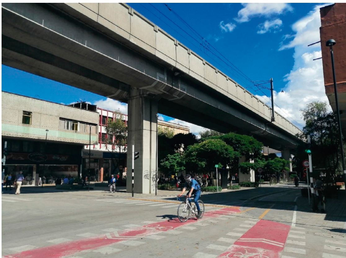
Figura 4. Ciclista utilizando la ciclorruta del Paseo Bolívar en Amador