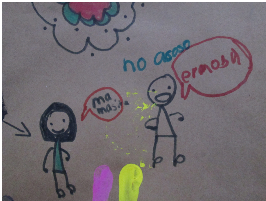
Figura 4 “No acoso”.

Finalmente, tras recuperar diferentes experiencias y narrativas de niñas y niños, una historia creada por un grupo de niñas de 7 años marcó el rumbo de las reflexiones en torno a los modos en que la ficción y la realidad confluyen. Después de haber compartido situaciones de abuso y violencia sexual en el barrio, las pequeñas propusieron un “cuento de Halloween” para narrar, resignificar y ordenar un conjunto de experiencias dolorosas vinculadas con la violencia sexual: