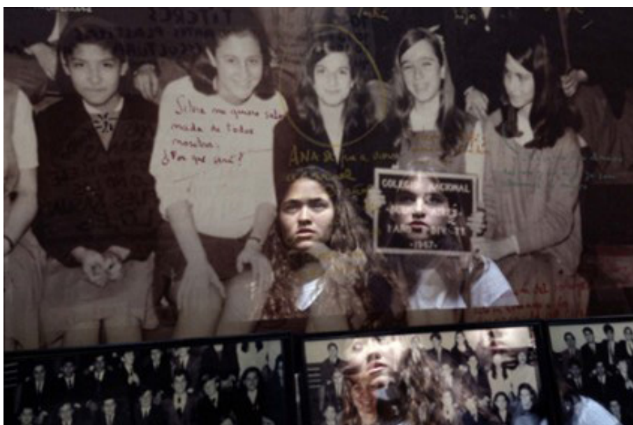
Foto de Marcelo Brodsky realizada en la exposición “El Puente de la Memoria” (1996) e incluida en el proyecto Buena Memoria (1997)

Fuente: Cortesía de Marcelo Brodsky y el Museo de Arte y Memoria de La Plata (Comisión Provincial por la Memoria de Buenos Aires).