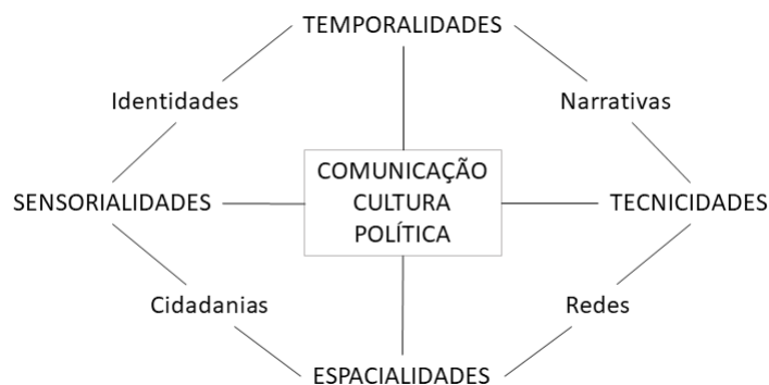
FIGURA 5 – Quarto Mapa Metodológico das Mediações – 2017 Mutações Culturais e Comunicativas Contemporâneas - 2