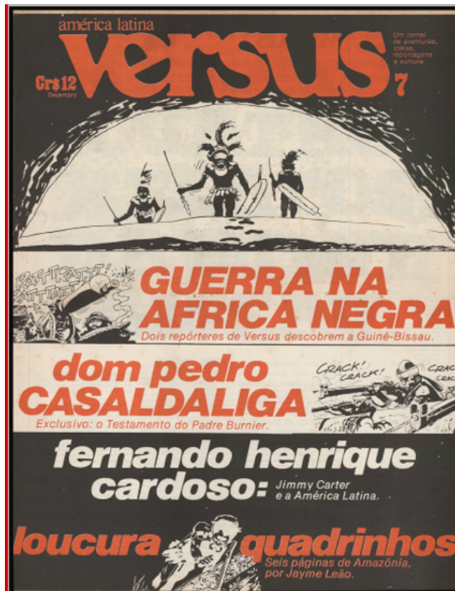
FIGURA 5 – Versus ,7, dezembro 1976. A capa, sem autoria, é uma montagem com desenhos de Hugo Pratt (os créditos aparecem na página 2)