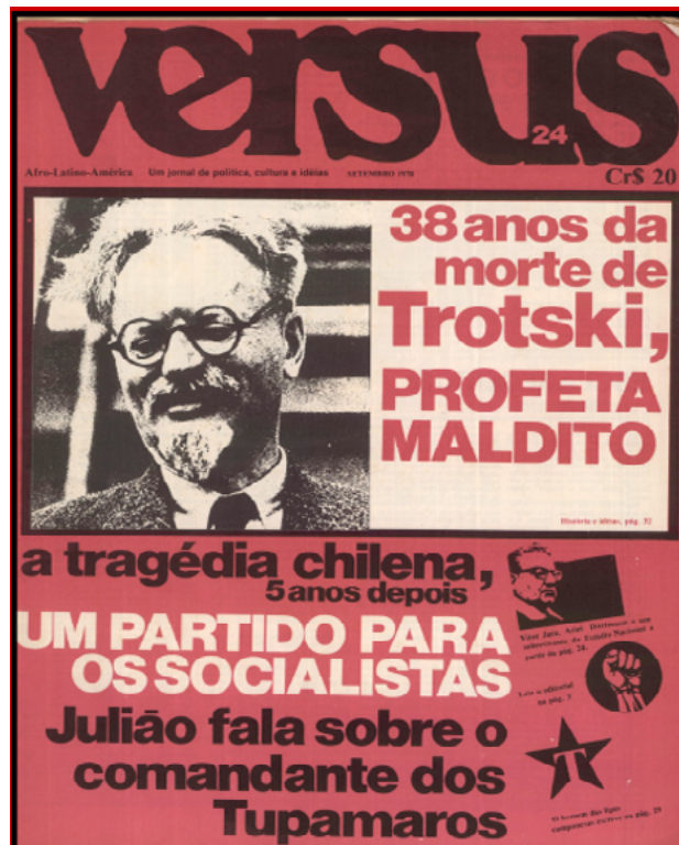
FIGURA 6 – Versus , 24, setembro 1978

No número 24, cuja capa traz, significativamente, uma foto de Trotsky, anunciando a comemoração dos “38 anos da morte do Profeta maldito”, celebra-se a “cerimônia de adeus” a Faerman, seus propósitos, seu estilo e seu grupo de apoio.