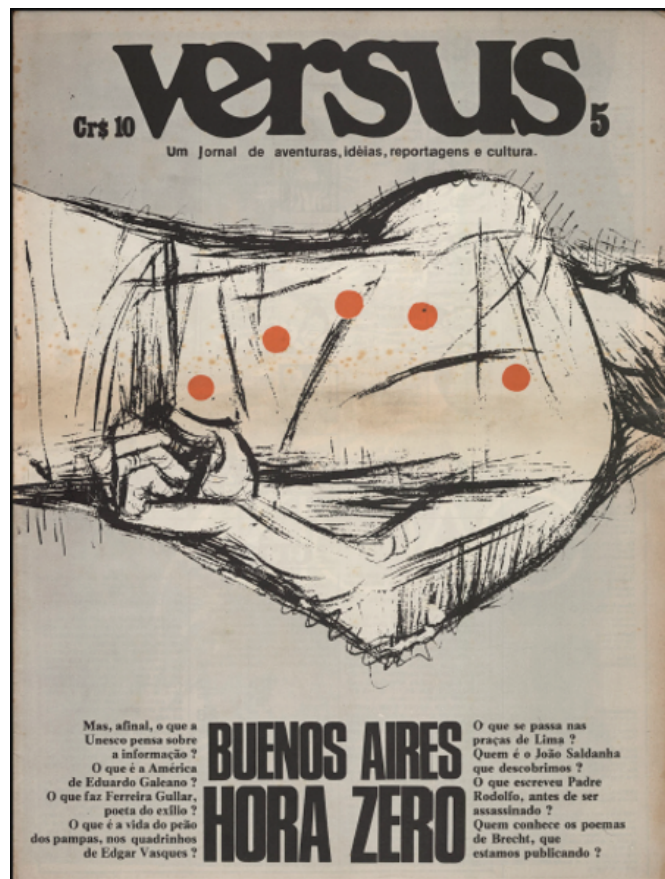
FIGURA 4 – Versus , 5. Capa de Carlos Clémen. Sob um corpo cravado de balas, o título “Buenos Aires, hora zero”, ladeado de perguntas, anuncia parte do conteúdo da revista.

periódicos alternativos foram semanários, enquanto outros obedeceram a prazos de circulação mais amplos e muitos não chegaram a respeitar uma temporalidade definida, quase invariavelmente devido a dificuldades financeiras. Curiosamente, quase nenhum deles se apresentava como revista. Versus , como já vimos, se anunciava como jornal, apesar de concentrar todas as características normalmente associadas às revistas: periodicidade dilatada; manutenção de um número de páginas fixo (cerca de 40 páginas por edição); produção editorial cuidadosa; inovação permanente da parte gráfica, com páginas muito bem construídas espacialmente, ilustrações e charges elaboradas e espaço privilegiado para histórias em quadrinhos; pauta construída sobre densas reportagens, artigos opinativos e entrevistas dinâmicas e inteligentes.