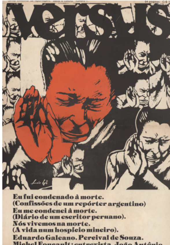
FIGURA 3 – Versus , 1, outubro 1975. A capa se organiza a partir de uma impactante imagem de um rosto masculino em estado de sofrimento, de autoria de Luis Gê, com uma seleção do conteúdo da revista: a morte como tema e metáfora da situação do país e do continente