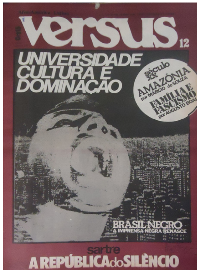
FIGURA 2 – Versus , 12, agosto-setembro 1977

8 Versus também se dedicou às causas negra e indígena no país. O tema indígena aparece desde o início da publicação, vinculado à questão da construção de uma identidade nacional e continental, associada às populações autóctones. A cultura negra e a abertura de espaço à voz de intelectuais negros apareceram depois. Como política editorial, surgiram, com o número 12 (agosto-setembro de 1977), com a matéria de capa: “Brasil negro: a imprensa negra renasce”, ilustrada por um rosto de um negro gritando em primeiro plano, com a cidade atrás, em tons de cinza, branco e marrom, sob o selo: “Afro-América Latina”.