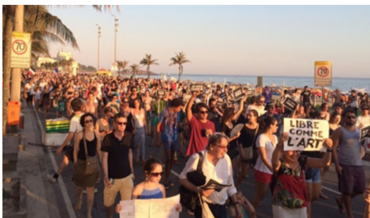
Figura 3. Manifestações no Rio de Janeiro ( https://glo.bo/2TIYT7X ).

Dezenas de imagens sobre manifestações e vigílias foram registradas, no entanto, a fotografia mais forte sobre o ocorrido, em termos plásticos e de sentido, foi publicada pela primeira vez no jornal Le Monde e posteriormente repercutida. Trata-se da única imagem do interior da redação após o fato. Publicada no dia 8 de janeiro de 2015, a fotografia (Figura 4) é precedida pela manchete “Atentado ao ‘Charlie Hebdo’: ‘você vão pagar caro por ter ofendido o profeta’”. A frase teria sido dita por um dos atiradores, porém, ao ser transformada em manchete, atualiza a cena do crime, permite a reocorrência do fato, com a diferença de que coloca o leitor como espectador do crime, como se o rastro de sangue pudesse ser seguido. Além disso, o destaque da frase, em tom de ameaça, gera um afetamento social que vai além do atentado ao Charlie , mas um atentado ao Ocidente, o que de algum modo já antecipa as ações de islamofobia 4 presentes em atentados posteriores, como o de Londres em 2017.