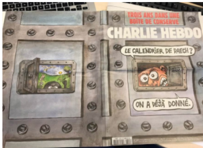
Figura 9. A imagem da transformação do mundo em uma “lata de conserva” ( https://bit.ly/2UfWfdV ).

Significa, portanto, que a leitura da agência de notícias AFP de o jornal já não ser mais o mesmo não é 100% equivocada. Porém, o não ser mais o mesmo não diz respeito apenas às questões econômicas e políticas capazes de decretar a vitória do Estado Islâmico. A publicação francesa reforça em suas edições especiais, por movimentos cíclicos de afastamento, devoração e contato – os quais se cristalizam como acontecimentos –, que o terror ainda prevalece, talvez agora mais forte em função da desmobilização social. Reforça ainda que as vidas já foram dadas , restando apenas permanecer sentindo os afetamentos das ações terroristas, mesmo aquelas que já nem mesmo fazemos questão de rememorar. A sombra do atentado se faz presente discursivamente, seja em forma de manifesto, seja na reiteração de nada ter mudado apesar do transcorrer dos anos. A imagem-representação da redação atingida passa a pairar sobre as imagens-metafóricas do ocorrido. Entende-se, assim, que a imagem-representação pode desaparecer enquanto fotografia ou vídeo, mas ela se instala como um duplo na própria palavra atentado. Não é preciso reavivar imageticamente a ação terrorista, porque ela permanece viva no imaginário midiático e social enquanto imagem-sombra que circula.