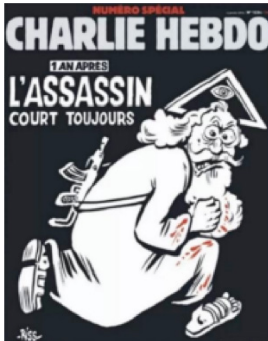
Figura 7. A manchete da publicação indica: “Um ano depois: O assassino ainda está solto” ( https://bit.ly/2OxCuZW ).

A sombra do atentado de janeiro de 2015, que carrega consigo os atentados de Londres, Madri e Nova York, se torna apresentável aos olhos em três momentos criativos desenvolvidos pela revista Charlie Hebdo , o qual, de alvo, se transforma em zona de contato. Em 2016, no aniversário de um ano do ocorrido, a publicação francesa trouxe como capa (Figura 7):