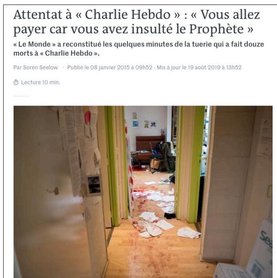
Figura 4. Única imagem da cena do crime, publicada no jornal Le Monde ( https://bit.ly/2OxkGOF ).

Para além das fotografias, o atentado também ficou marcado pela resposta de cartunistas, chargistas e atores sociais que compartilharam imagens tensionadoras do fato nas redes sociais. Algumas vinculavam explicitamente o ataque de 2015 com o de 2001 (Figura 5), como fez o cartunista holandês Ruben L. Oppenheimer.