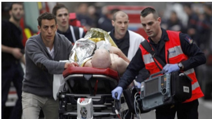
Figura 1. Retirada das vítimas foi uma fotografia recorrente, mas incapaz de dimensionar o ataque ( https://glo.bo/2ux3KP4 ).

um prédio-símbolo, mas da tentativa de calar profissionais da imprensa que defendiam a crítica e a liberdade. Dito de outro modo, as imagens produzidas do atentado ao Charlie Hebdo , ainda que buscassem se constituir em uma representação, não tinham o caráter do registro do instante, porque o acesso ao local do atentado e a sua própria forma de execução foram diferentes daquele em 2001. Os assassinatos se deram no interior da redação, sendo impossível reviver o instante, pois as primeiras imagens já dão conta do resultado da ação (corpos, feridos, ação policial). No 11 de setembro, o atentado ocorre diante dos olhos, não apenas dos presentes, mas dos que assistiam à televisão e aos registros de celular, resultando em uma reocorrência. Além disso, há de se destacar que as Torres Gêmeas tinham um alto grau de reconhecimento e, portanto, de identificação. Já as imagens do atentado ao Charlie não permitem uma distinção clara de imagens de outros atentados. Isto implica dizer que as imagens do prédio da redação sendo invadido, da retirada das vítimas (Figura 1), do cordão de isolamento policial, não foram suficientemente aderentes a ponto de figurativizar o atentado, ainda que tenham sido amplamente utilizadas.