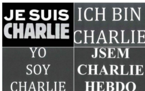
Figura 2. Imagem do site da revista Charlie Hebdo horas após o ataque ( https://bit.ly/2FIgusL ).