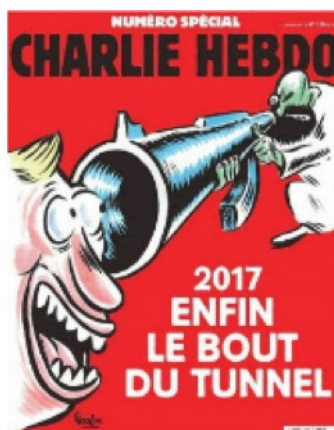
Figura 8. Capa da edição especial de 2017, dois anos depois ( https://bit.ly/2TGfb1d ).

Observa-se que a charge que integra a totalidade da capa é de autoria do então editor da revista, Laurent Riss, um dos sobreviventes ao atentado, e que a figura retratada é de um muçulmano, identificado pela roupa, armado e com sangue nas mãos. Ao mencionar que os assassinos estão soltos, o leitor é diretamente levado a recuperar, em sua memória, as imagens do atentado, das vítimas, do sangue derramado. Não é preciso que as imagens-registro voltem à cena, elas ainda estão presentes. Já em 2017, a publicação nos contata, ou tenta criar o vínculo, a partir da investida “Finalmente, o fim do túnel” (Figura 8).