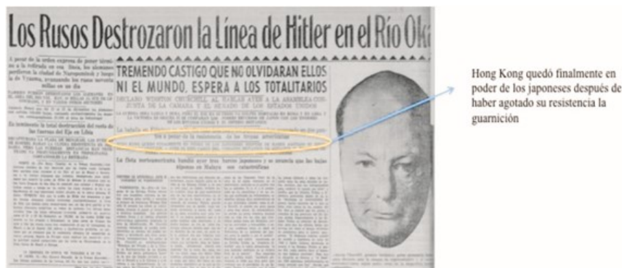
Figura 7 RUSOS DESTROZAN LA LÍNEA DE HITLER Diario de Costa Rica, 27-12-1941, p. 1.