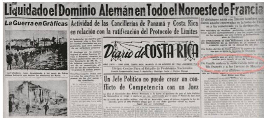
Figura 9 LIQUIDADADO EL DOMINIO ALEMÁN Diario de Costa Rica, 15-08-1944, 1.

El 24 de agosto de 1944, el mismo día de la liberación de París, el Diario de Costa Rica anunció el hecho con el sonido de la sirena, el medio usado solo para avisar los principales hechos noticiosos. Con orgullo destacó en la primera página la siguiente leyenda, evidenciando su capacidad de inmediatez: