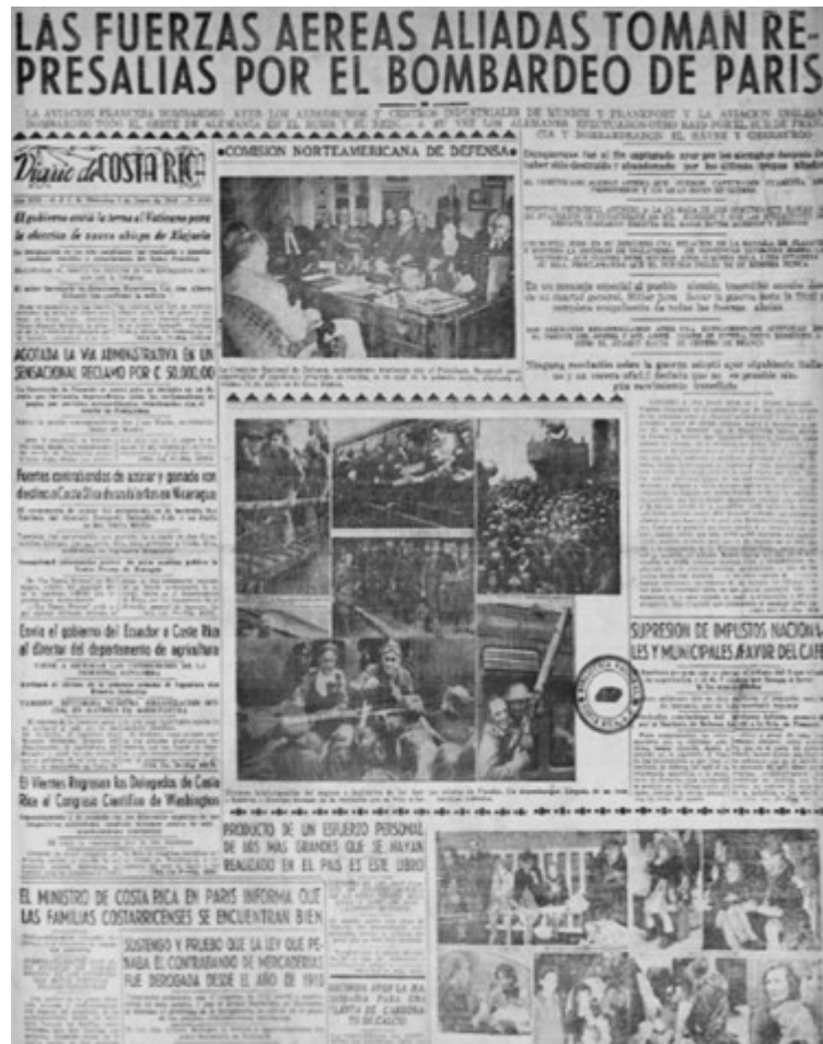
Figura 1 LOS BOMBARDEOS AÉREOS A PARÍS POR EL EJÉRCITO ALEMÁN Diario de Costa Rica , 05-06-1940, 1.