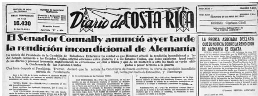
Figura 12 ALEMANIA SE RINDE Diario de Costa Rica , 29-04-1945, 1.

Con fecha 28 de abril, la PA declara que su noticia sobre la rendición de Alemania es exacta, toda vez que el presidente estadounidense aseveró que la noticia divulgada por la agencia carecía de fundamento.