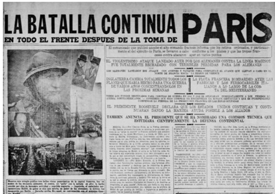
Figura 2 LA BATALLA CONTINÚA AUNQUE PARÍS FUE TOMADA Diario de Costa Rica, 15-06-1940, 1.

Los subtítulos confirman la intencionalidad del diario: de los ocho apartados principales de la primera página, solo uno hace referencia al avance alemán y siete confirman el progreso de los franceses o las acertadas acciones de los aliados (Tabla 1).