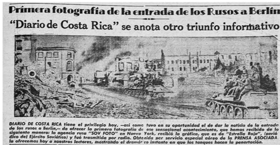
Figura 13 RUSOS ENTRAN A BERLÍN Diario de Costa Rica , 28-04-1945, 1.

La agencia rusa “SOY FOTO” en Nueva York, recibió la gráfica, que es de “Estrella Roja”, (periódico del ejército soviético) y fue transmitida por radio. Obtenida por servicio especial aéreo de la PRENSA ASOCIADA [y agregaban que] la ofrecemos hoy a nuestros lectores, mostrando el dramático instante en que los tanques hacen su penetración ( Diario de Costa Rica , 28-4-1945, 1) (Figura 13).