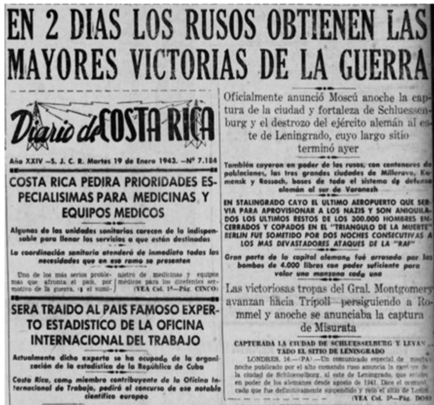
Figura 5 RUSOS OBTIENEN LAS MAYORES VICTORIAS Diario de Costa Rica , 19-1-1943, 1.