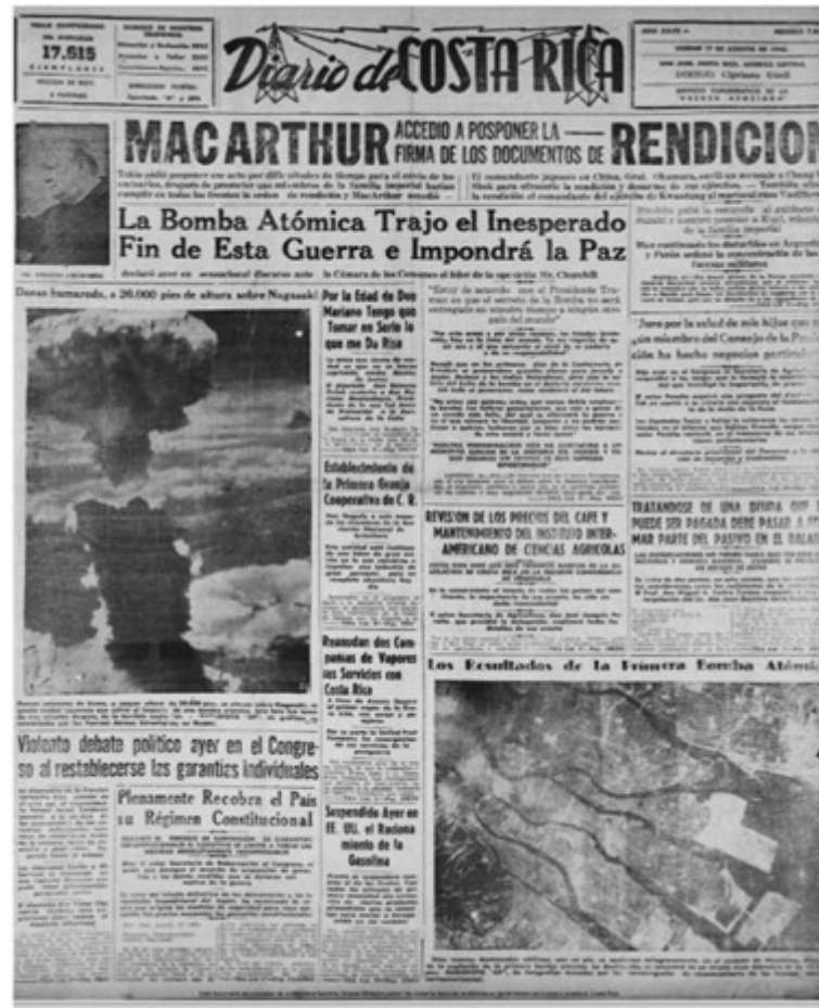
Figura 15 DESTRUCCIÓN CAUSADA POR LA BOMBA ATÓMICA Diario de Costa Rica , 17-08-1945, 1.