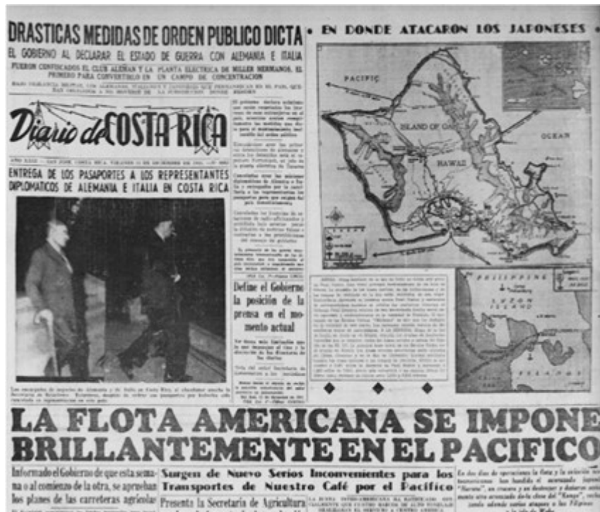
Figura 6 MOVIMIENTOS BÉLICOS Diario de Costa Rica , 12-12-1941, p. 1.

En efecto, el ingreso oficial de Estados Unidos significó un antes y un después en la Guerra: