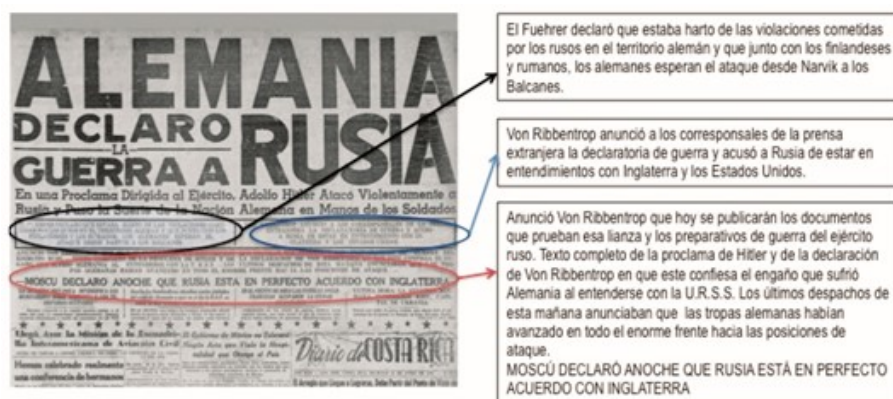
Figura 4 DECLARACIÓN DE GUERRA ALEMANA Diario de Costa Rica , 22-6-1941, 1.

Esta ambivalencia inicial se debe a que el 23 de agosto de 1939, pocos días antes de iniciarse la Segunda Guerra Mundial, la Alemania Nazi y la Unión Soviética habían firmado el Pacto Ribbentrop-Mólotov en el cual destacaban las cláusulas de no agresión mutua y el interés de estrechar vínculos económicos con tratos preferenciales, además, y quizá el más importante, se comprometían ambos a no hacer alianzas políticas o militares contraria al otro. Adicional, en un protocolo secreto, ambos establecían sus límites de influencia en zonas específicas, en las que ninguno podría intervenir.