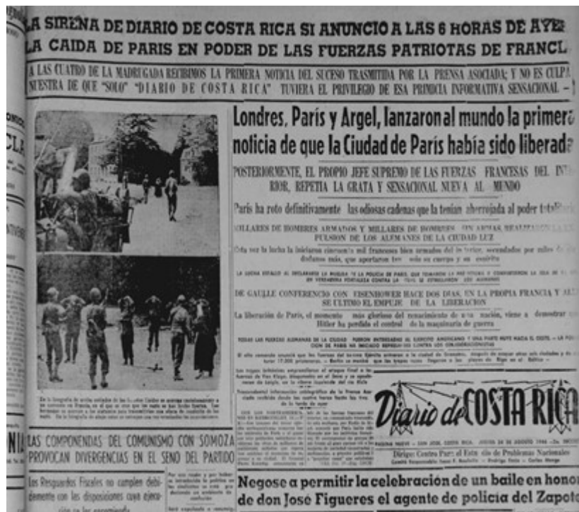
Figura 10 COMPETENCIA POR INFORMAR Diario de Costa Rica , 25-08-1944, 1.

Al día siguiente, 25 de agosto, abiertamente se enfrenta a sus competidores defendiendo que había sido el primero en divulgar la información: