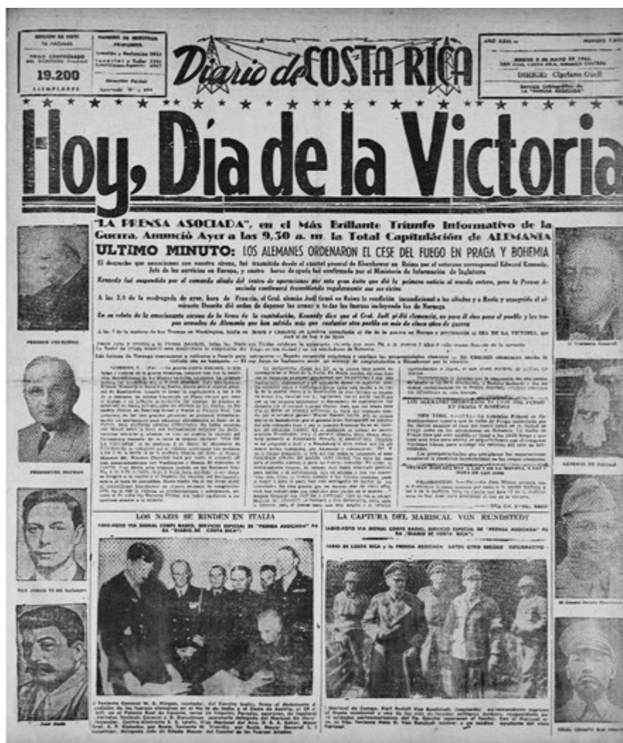
Figura 11 DÍA DE LA VICTORIA Diario de Costa Rica, 8-05-1945, 1.

Las especulaciones periodísticas sobre la rendición de Alemania eran frecuentes desde el mes de abril de 1945 y aun antes. El 30 de ese mes, Hitler se suicidó en el Bunker dando por hecho el gane de los aliados.