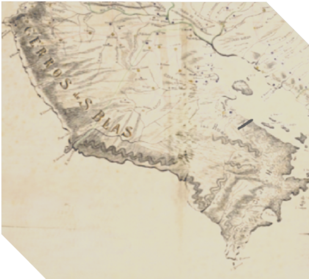
Figura 2. Segmento que comprende la Península de Nicoya, Costa Rica, 1906

La noción de territorialidad es utilizada aquí para explicar el fraccionamiento político- administrativo de la península de Nicoya ocurrido en el último tercio del siglo XIX. Los postulados de Robert Sack (1986, p.19), facilitan la comprensión de los mecanismos e intenciones de los grupos humanos que toman posesión de Cóbano, Paquera y Lepanto en el periodo en estudio. Dichos espacios son progresivamente ocupados por migrantes venidos de Puntarenas, Abangares y el occidente del Valle Central. Así, van adquiriendo terrenos mediante denuncios, compras directas y heredades. Se dedican a la explotación maderera, pequeños fundos familiares y parcialmente a la cría de ganado. De manera adicional, se constituyen en productores de granos para el comercio y el sustento, no solamente suyos, sino del núcleo central de la comarca de Puntarenas.