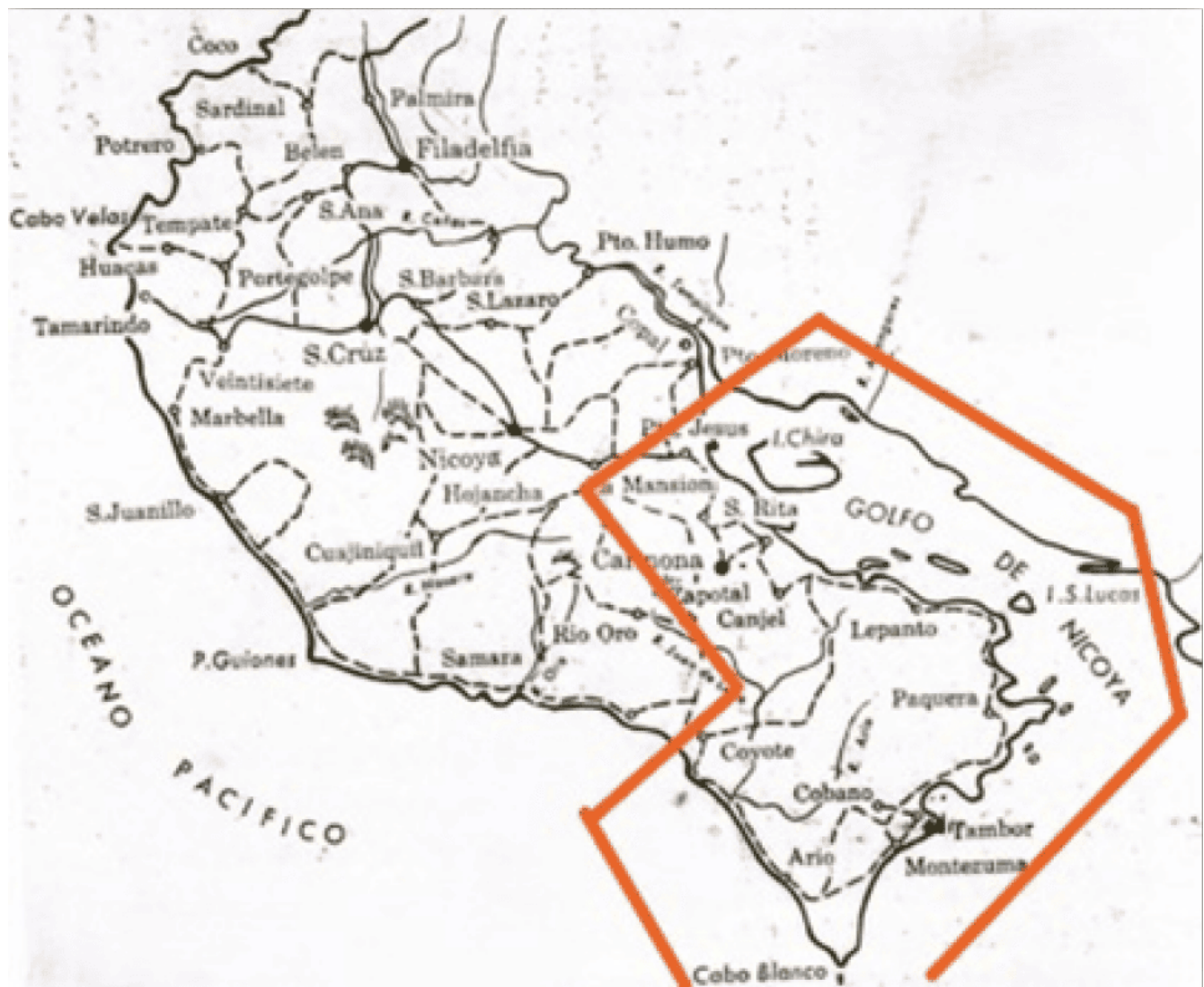
Figura 1. Espectro geográfico de Puntarenas, Costa Rica, S.XIX

Como si fuera poco, el argumento de Valverde conduce al tema de la naturaleza de las poblaciones surgidas en dicho espacio geográfico. Los territorios de Paquera, Lepanto y Cóbano son catalogados por la autora como “los pueblos de la costa” pero de Puntarenas, y se caracterizan por ser surtidores de granos hacia la ciudad puerto. Incluso, la autora indica que antes de la inauguración de la carretera interamericana en 1952, una gran parte de la producción, así como las personas de las comunidades nicoyanas anexas a la península, dependían del traslado vía marítima hacia Puntarenas. Así, el punto de referencia para las actividades socio-productivas y, en general, para la vida social de dichas comunidades, se construyó a través del puerto de Puntarenas.