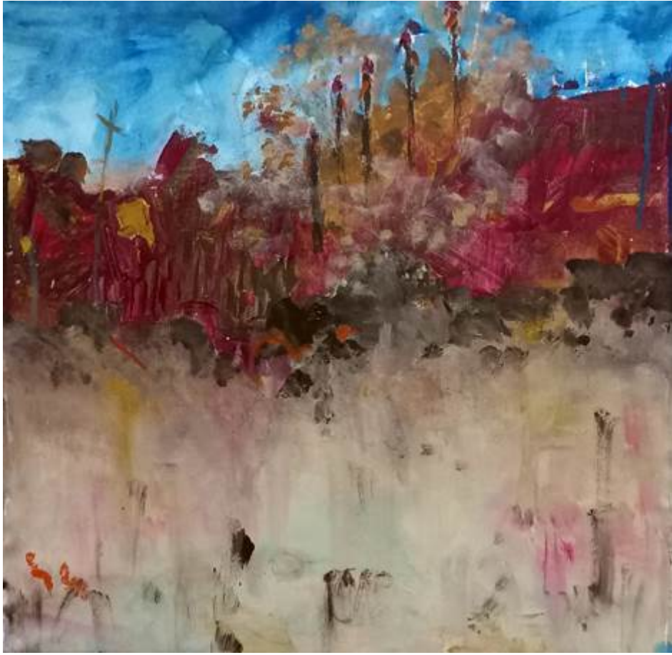
Malón, acrílico. Rosana Moreno