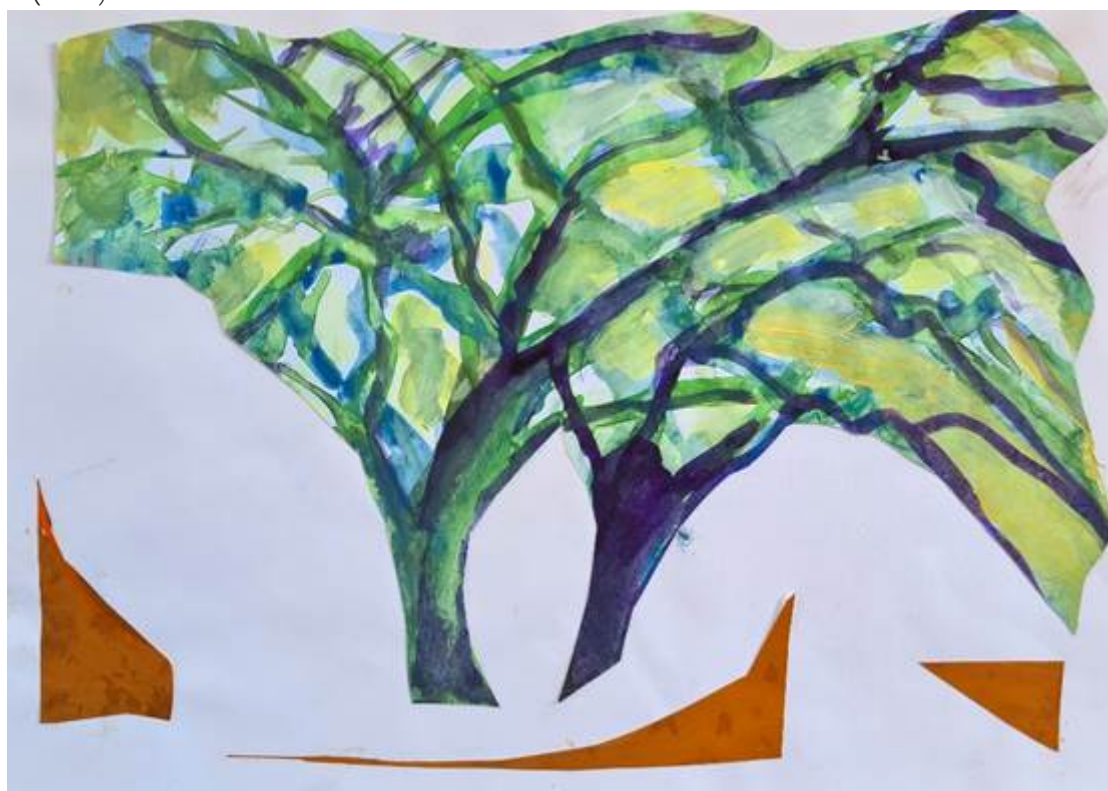
Paisaje pampeano XIII, tinta y acrílico. Ana María Martín

Este trabajo se ha realizado al amparo del proyecto de investigación “Laboratorio de Innovación Docente de Artes y Humanidades” (PII2020_18), subvencionado por la Universidad Internacional de Valencia (VIU).