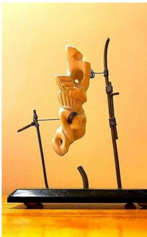
Ensayo, cerámica y bronce. Gustavo Gaggero