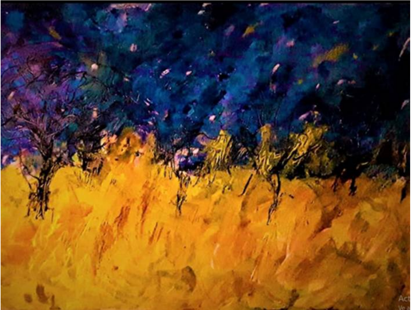
Tormenta en el trigal, técnica mixta. Adriana Chavarri

En este artículo buscamos diferenciar conceptualmente los dos componentes de la noción de desigualdad socioeducativa. Enfocarnos en el componente educativo de este palabra compuesta, desde una mirada sociológica que obliga a considerar el contexto y evitar romanticismos respecto de que la institución lo puede todo, nos libera del fallo miserabilista de que la escuela no puede nada.