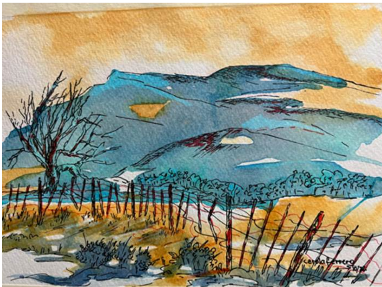
Cordillera azul, anilina y tinta. Carola Ferrero Alonso