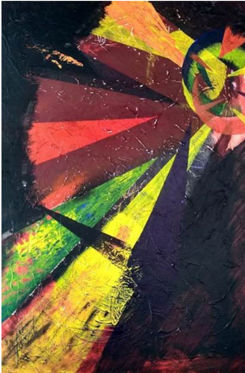
Latinoamérica, acrílico. Matías Sapegno

En este sentido, sería valioso reabrir el debate, a través de investigaciones dedicadas a esta vertiente, respecto de los aportes que las ciencias de la religión pueden proporcionar al diseño de un currículum para la CR con una validez más amplia, robusta y pertinente para el campo de la educación escolar. En la perspectiva de quienes escriben este artículo, un camino interesante es aquello de una combinación epistemológica entre la fenomenología de la religión (Van der Leuw, 2017) y los datos que aportan las ciencias de la religión: esta combinación tiene la ventaja de no plantear una CR que reduce el fenómeno religioso a mera producción humana, sino que deja abierta y justificada la posibilidad que haya una trascendencia que se revela a través de las religiones. A su vez, las autoridades competentes (laicas y religiosas) podrían encontrarse en comisiones de trabajo para generar un marco normativo renovado para la clase de religión, que permita combinar las finalidades de formación integral y espiritual y el respeto al fenómeno religioso con un andamiaje epistemológico-educativo acorde al lugar de la escuela.