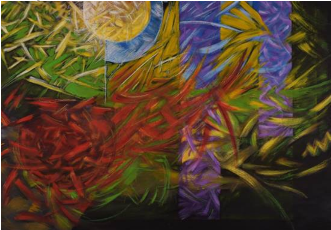
“Ferma x Gaggero”, óleo_sobre_bastidor_de_fibrofácil. Gustavo Gaggero

De esta manera, cabe remarcar que las prácticas de articulación impulsadas desde la UDELAR se enmarcan en una concepción basada en el impulso a la democratización de la enseñanza superior. Estas implican un posicionamiento desde una perspectiva de responsabilidad institucional, donde se visualiza la importancia del acompañamiento en la interfase con la enseñanza media, así como respecto a los aprendizajes de los estudiantes. Sin embargo, persisten desafíos para el logro de una mejor articulación con la educación media, y en particular en lo que concierne a las áreas STEM.