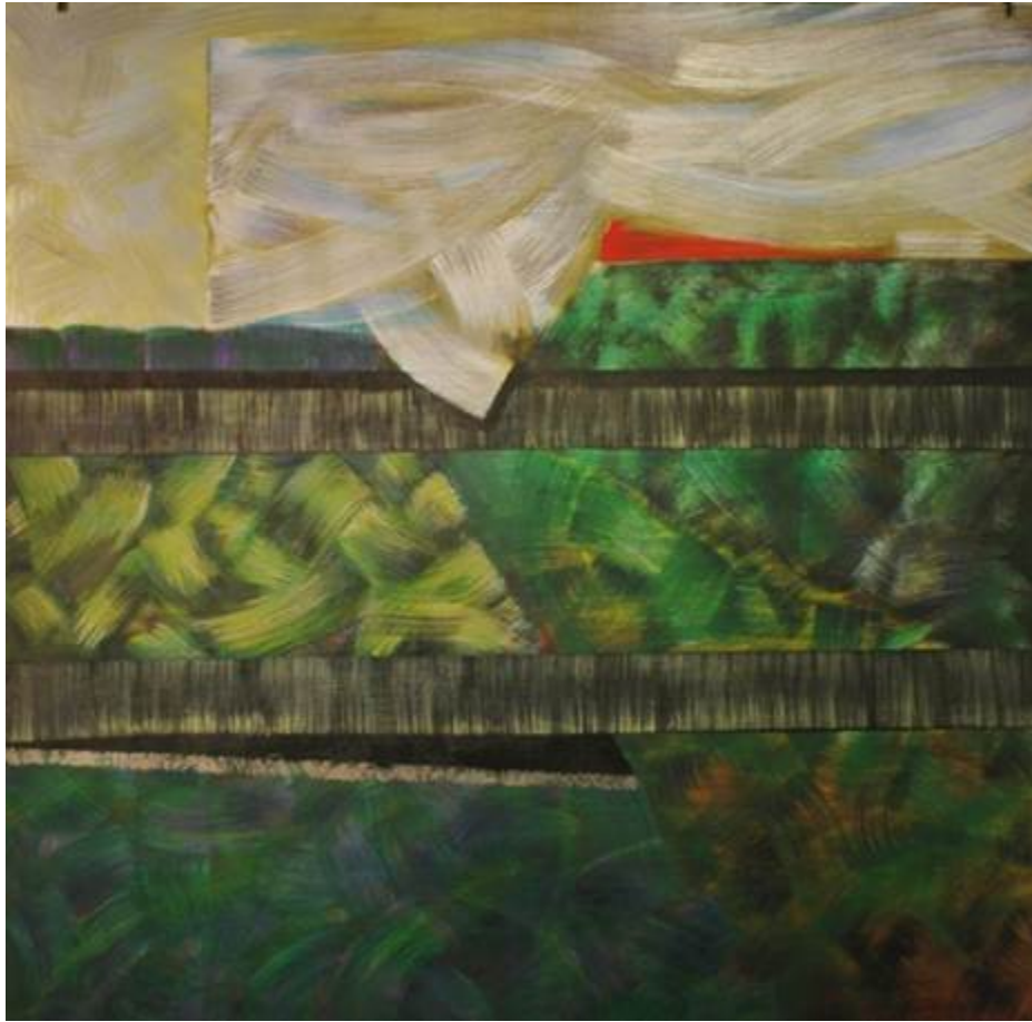
Al trotecito, óleo, Gustavo Gaggero

siempre un manifiesto incierto para un manifiesto de incertidumbres. ¡La ICT es ahora una teoría contra el ethos epistemológico del campo!