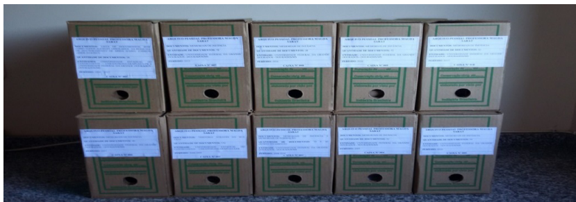
FIGURA 2 – ARQUIVO PESSOAL – DOCUMENTOS INVENTARIADOS E REORGANIZADOS 6