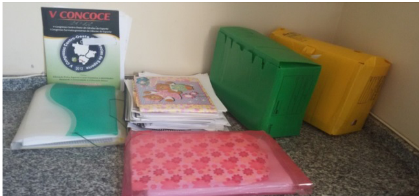
FIGURA 1 – ARQUIVO PESSOAL – DOCUMENTOS ENTREGUES PARA A PESQUISA