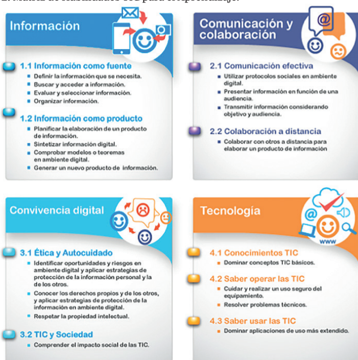
Figura 2. Matriz de Habilidades TIC para el Aprendizaje.

La prueba PISA de la ODCE, que tradicionalmente había evaluado tres clases de competencia –en lengua, matemática y ciencia–, ha incluido a partir de 2009 la competencia para la lectura digital – digital reading literacy –, basándose en el entendido de que “Thus, digital reading cannot always be strictly compared to print reading. This is, in fact, the best evidence in support of the design of a new framework and new assessment procedures for digital reading.” (OCDE, 2009, p. 36). No todos los países de América Latina participan en la prueba de lectura digital de Pisa.