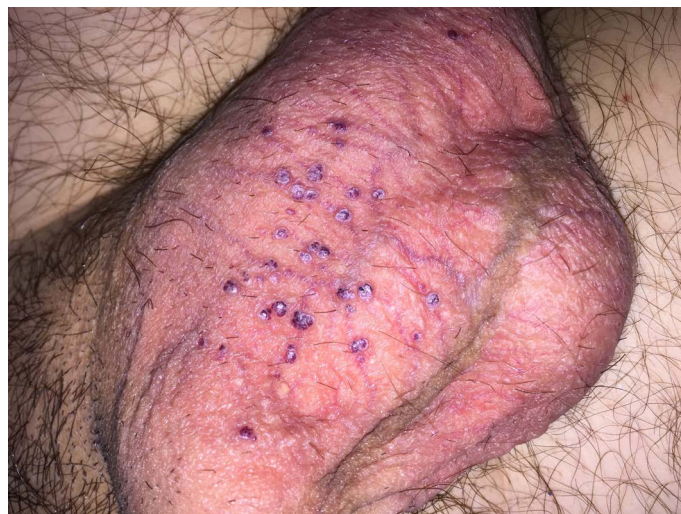
Figura 1. Aspecto clínico de las lesiones

Se objetivan múltiples pápulas de color rojo-violáceo que son dilataciones de los vasos sanguíneos localizados en la dermis superficial asociados a mínima hiperqueratosis de forma bilateral.