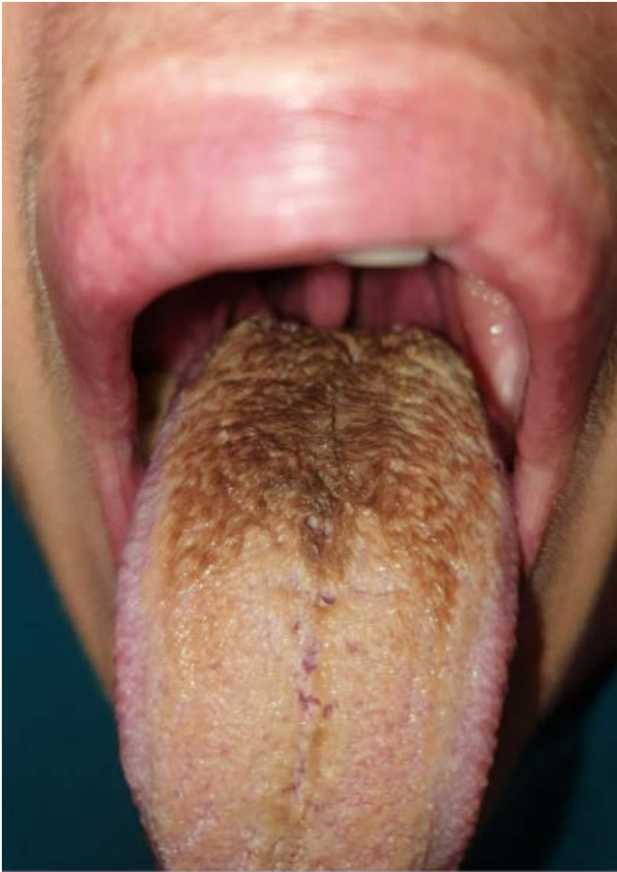
Figura 1. Diagnóstico inicial

Bajo la impresión diagnóstica de leucoplasia oral vellosa al descartar otros diagnósticos diferenciales, se enfoca el tratamiento en promover una adecuada higiene oral, reducir el consumo de tabaco y hacer enjuagues bucales con clorhexidina al 0,12%, con controles periódicos. Después de 6 meses de tratamiento, la paciente acude a revisión ( figura 2 ) y se observa una disminución en el tamaño de la placa, así como una reducción del color pardo en comparación con la fotografía tomada en la primera consulta. La paciente también informa de la desaparición de la sensación de disgeusia y de una disminución de la halitosis que presentaba.