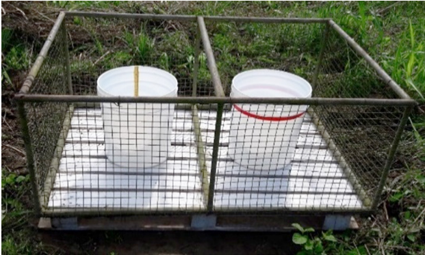
Figura 1. Recipientes plásticos para medición de evaporación

Tanto para el funcionamiento del Cenirrómetro como en el tanque evaporímetro clase A, se utilizaron dos recipientes de color blanco, con dimensiones de 30 cm de diámetro en la parte superior y 40 cm de altura (Figuras 1 y 2).