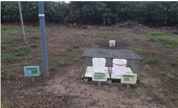
Figura 2. Equipo instalado considerando la distancia del cultivo a barlovento.

Estos recipientes se ubicaron sobre una plataforma de 10 cm de altura y fueron protegidos con malla para evitar el ingreso de animales. Las mediciones bajo la concepción de la metodología del tanque clase A se realizaron considerando que en los recipientes plásticos se produce una evaporación 9% mayor que en el tanque antes mencionado (Torres y Cruz, 1995), cuyas dimensiones estándar son 120.7 cm de diámetro y 25 cm de altura (Allen, et al. , 2006). Por tanto, la evapotranspiración del cultivo ( ET_c ), conteniendo axiomáticamente a la evapotranspiración de referencia ( ET_o ), según el método del tanque evaporímetro, fue establecida por la ecuación 2, en donde K_{tan} es un coeficiente tabular del tanque que depende de la velocidad del viento, de la humedad relativa, del tipo de cubierta alrededor del tanque y de la distancia del cultivo a barlovento (Allen, et al. , 2006).