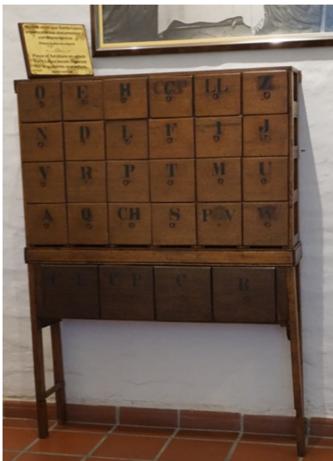
Figura 1. Archivador madre Laura.