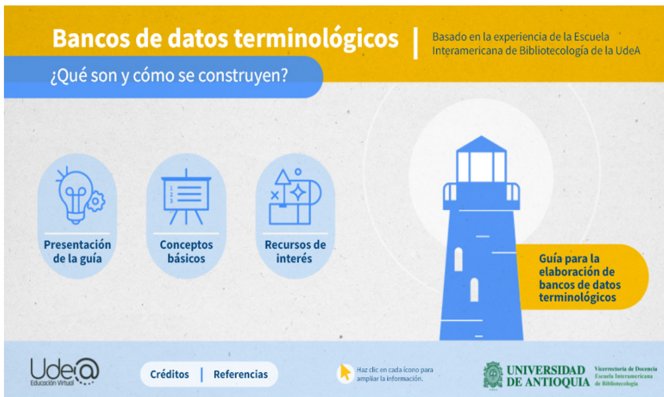
Figura 4. Objeto virtual de Aprendizaje: Banco de datos terminológicos.