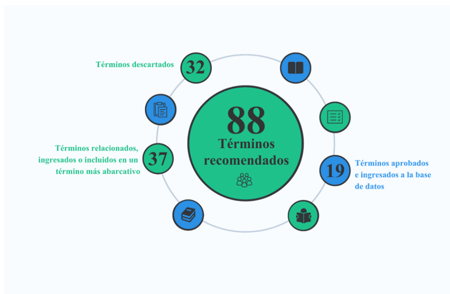
Figura 3. Resultado de los términos recomendados por los grupos focales.