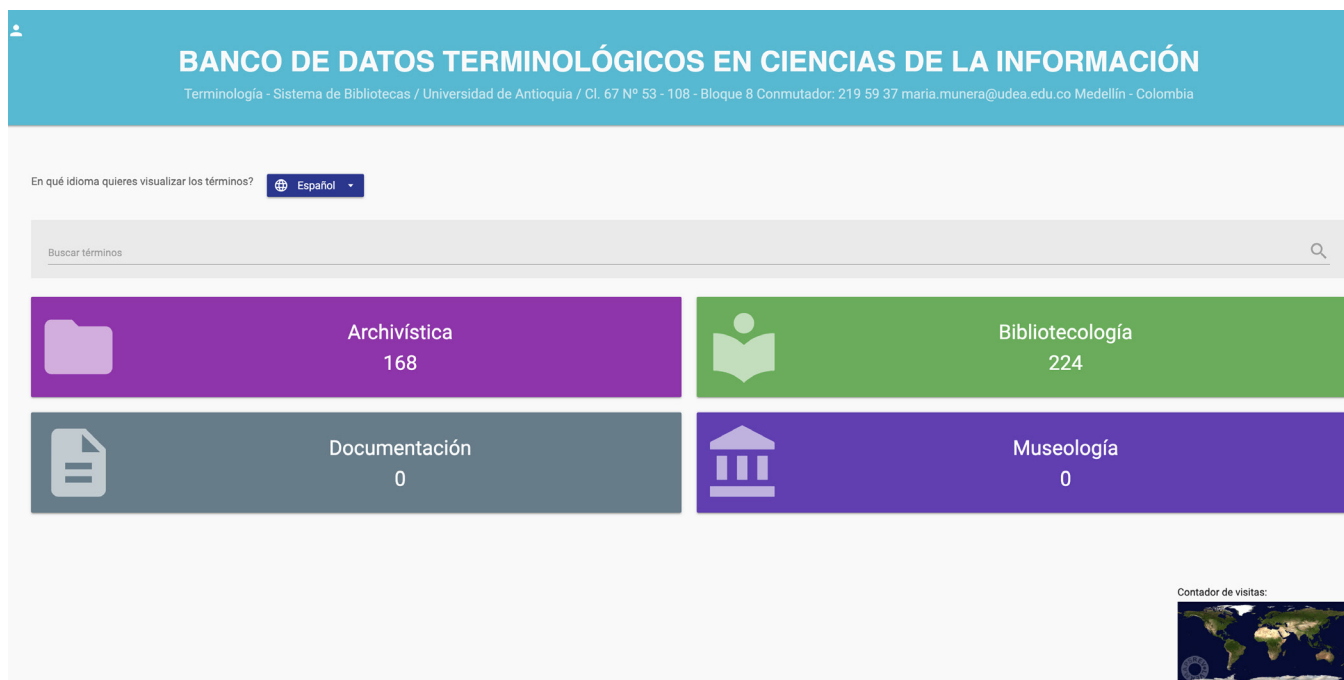
Figura 2. Interfaz del BDT-CI y sus respectivas bases de datos sobre archivística, bibliotecología, documentación y museología.

En concreto, se hallaron 24 términos simples (formados por una sola unidad o palabra) y 177 términos compuestos (formados por más de una palabra), en los que el patrón sintáctico sustantivo+adjetivo resultó ser el más frecuente. Los términos se encuentran organizados de forma alfabética y se pueden consultar en español, inglés y portugués.