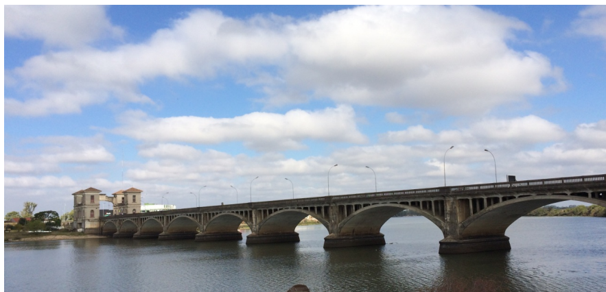
Figura 1: Puente Internacional Barão de Mauá visto del lado brasileño

largo, simétricamente contruidos. El espacio entre ellos es de 13 metros. La arquitectura de las aduanas mezcla el llamado “eclecticismo de frontera” (IPHAN, 2015).