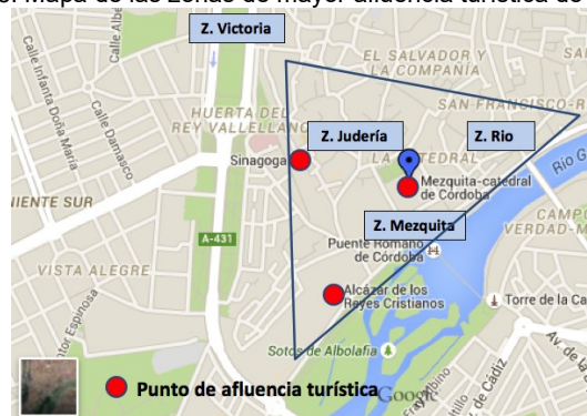
Figura 3: Mapa de las zonas de mayor afluencia turística de Córdoba