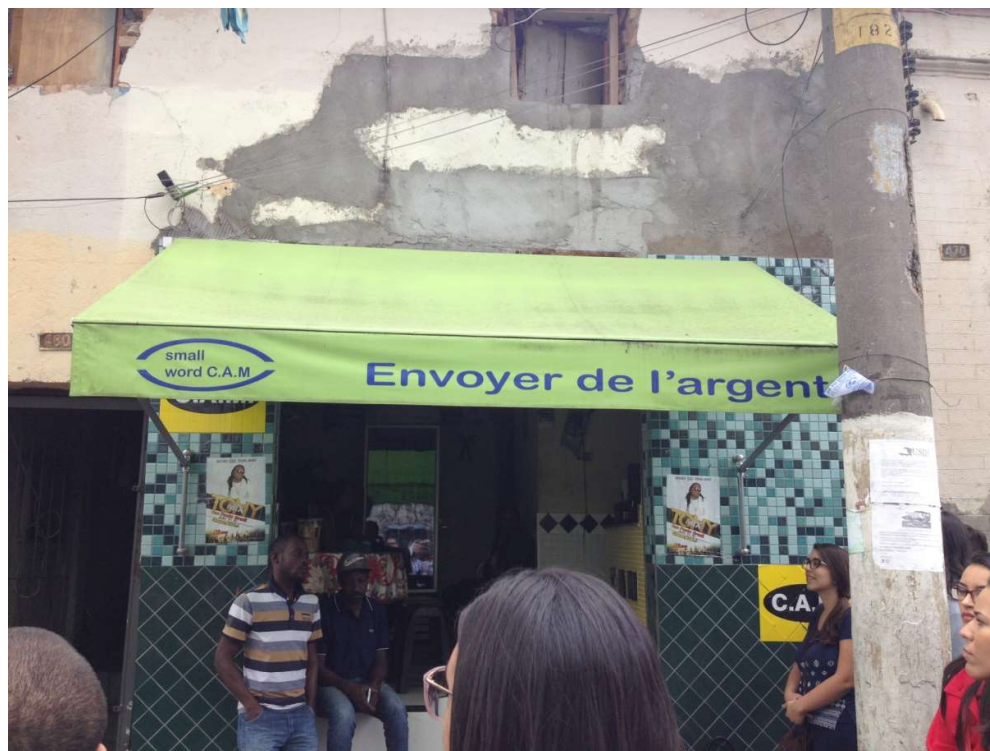
Figura 6: Casa de cambio en la Región de Glicério