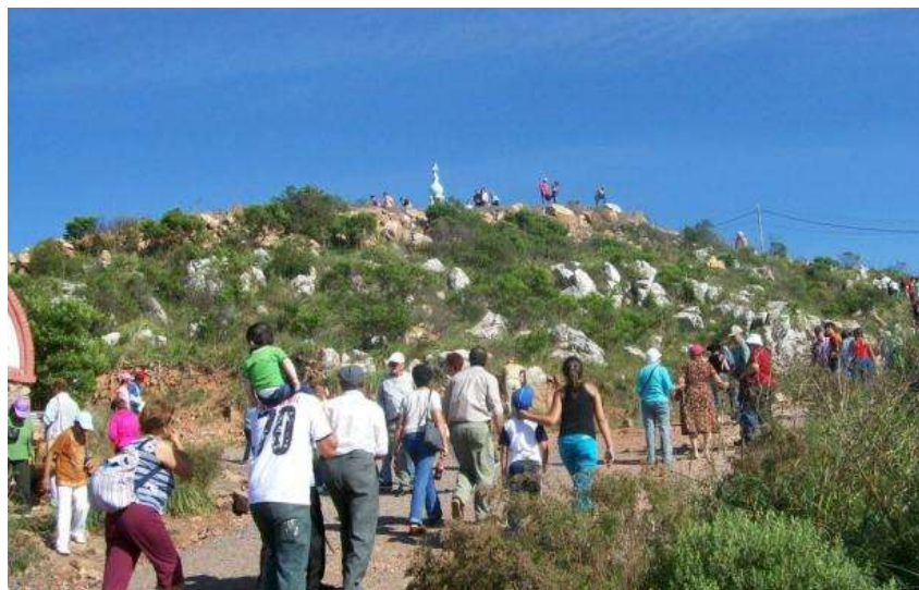
Figura 5: Creyentes y fieles católicos durante la procesión anual a la Virgen del Verdún