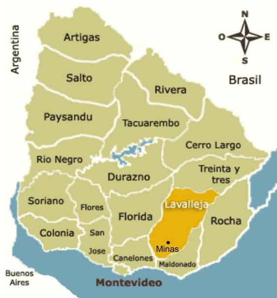
Figura 1: Mapa con la localización del Departamento de Lavalleja y la Ciudad de Minas

Si bien la práctica del turismo religioso consta de una larga data en dicho departamento, éste siempre estuvo limitado a las peregrinaciones que se realizan a la Virgen del Verdún. Éstas se realizan en forma masiva todos los 19 de abril desde 1901, y también todos los fines de semana del año se constatan visitas (en menor escala) al santuario. En cambio, el devenir histórico del turismo místico es diferente. Éste se ha venido expandiendo desde el año 2000 hasta consolidar en la actualidad una variada gama de atractivos turísticos.