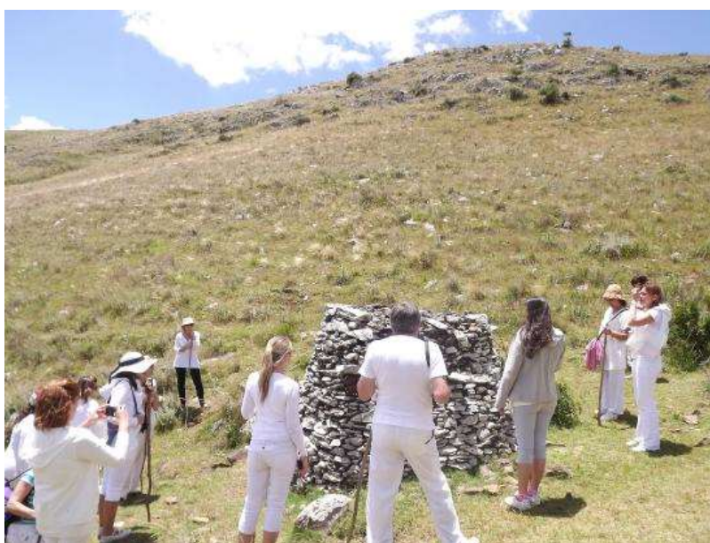
Figura 4: Turistas contemplando un “cono de piedra” durante una de las paradas de la visita guiada en el valle “El Hilo de la Vida”

Sin duda, el rasgo en común que caracteriza a todos estos “atractivos turísticos” es la concepción energética del territorio (Gamboa, 2016a: 122). Por ello, en este artículo se ha tomado la noción de turismo místico como macro-categoría de análisis, para de esta forma poder diferenciar sus distintas modalidades del turismo religioso. Dicha categoría de análisis funcionó en esta investigación como un concepto operativo.