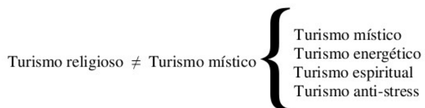
Figura 3: Esquema conceptual del turismo místico como macro-categoría de análisis

En el plano metodológico se construyó una macro-categoría de análisis, con el objetivo de englobar las diversas modalidades de turismo místico que se practican actualmente en el Departamento de Lavalleja. Esta macro-categoría fue elaborada para diferenciar las distintas variantes del turismo místico (turismo energético, turismo espiritual, turismo místico, etc.) de turismo religioso (Figura 3). Esta macro-categoría de análisis tiene el propósito de agrupar las distintas variantes del turismo místico para diferenciarlo del fenómeno del turismo religioso. El criterio teórico-metodológico adoptado se basó en la plataforma que las distintas modalidades de turismo místico tienen en común. La plataforma que transversaliza los atractivos turísticos en donde se practica actualmente el turismo místico en el Departamento de Lavalleja constituye la “energía” inmanente del territorio.