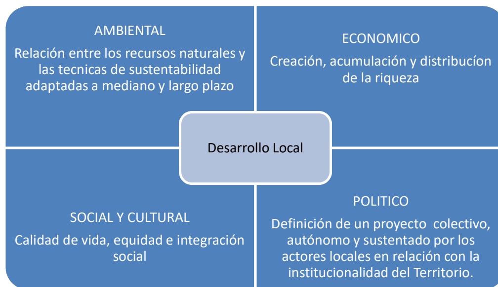
Figura 1: Enfoques del desarrollo local