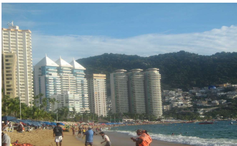
Figura 4: La Zona Dorada de Acapulco (Guerrero), 2016

tradicional dorado y diamante. Ello se debe a los problemas internos del puerto (en un primer momento la contaminación ambiental, actualmente son los altos niveles de violencia que registra). Así como la fuerte competencia que existe tanto a nivel nacional como internacional. Por dichas razones, Acapulco no será visitado por turistas internacionales. Pero sí por el turista doméstico, sobre el todo el que procede de la Zona Metropolitana del Valle de México; esa cercanía que guarda con la capital del país, lo hará accesible (Cárdenas, 2016: 92). Las cifras son contundentes, para el 2016 se contabilizaron 5.634.530 visitantes de los cuales 5.543.995 eran nacionales y 90.535 eran extranjeros (Compendio Estadístico del Turismo en México, 2016). En este marco se está de acuerdo con Ocampo (1994: 42) cuando afirma que Acapulco “sólo atrae un turismo poco exigente y de medianos recursos” . Una vez más, la posición estratégica que tiene Acapulco, así como el contar con un camino ágil le harán mantener su vitalidad, tal y como se ilustra en la Figura 4.