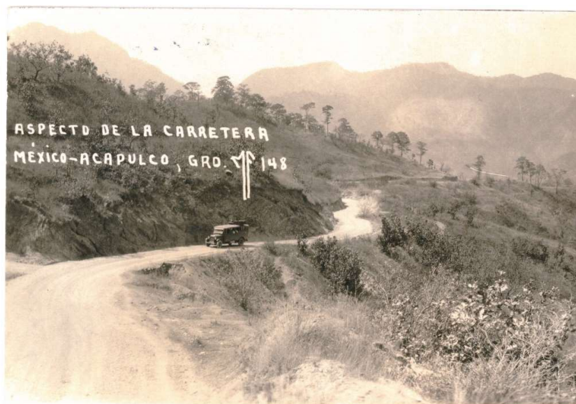
Figura 1: Aspecto de la carretera México-Acapulco (Guerrero)