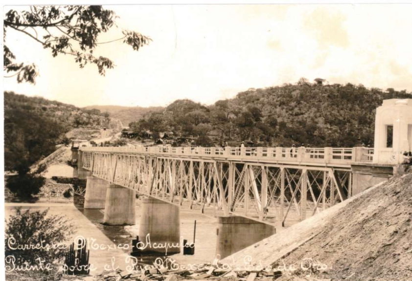
Figura 3: Puente Mezcala en la carretera México-Acapulco