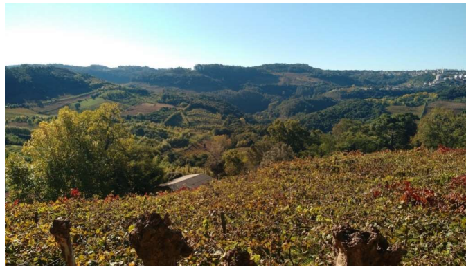
Figura 2: Paisaje del viñedo del Vale dos Viñedos

Con un clima subtropical húmedo y caliente, densos bosques nativos y altitudes desde los 450 a los 650 metros marcados por una topografía accidentada representaban un especial desafío al cultivo de uvas. Según Valduga (2011) la región recibió un flujo masivo de inmigrantes de origen italiano, sobre todo del Veneto, Lombardía, Trento y Friuli alrededor de 1875. Esos inmigrantes vinieron en una política de ocupación territorial del interior septentrional del país y asumieron la paternidad de la vitivinicultura brasileña. Aunque muchas de las variedades de uva cultivadas eran del tipo labrusca - como isabel y bordô - el típico sistema de conducción adoptado en los cultivos fue la pérgola, tradicionalmente utilizada en los viñedos de la Valpolicella, Italia, como se puede observar en la Figura 2. A partir de los años 1920 fueron introduciendo variedades de origen europeo plantadas en el sistema de espaldera diversificando el paisaje del viñedo (Falcade, 2011).