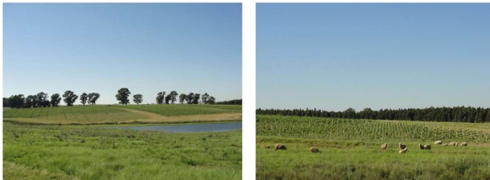
Figura 3: Paisaje del viñedo de la Campanha Gaúcha

La topografía plana del terreno posibilita un alto nivel de mecanización de los viñedos, en su casi totalidad de cepas viníferas, plantados en espaldera, que marcan el paisaje de una región de horizontes amplios (Figura 3). Aunque muchas bodegas hayan empezado con proyectos de infraestructura y fomento del enoturismo, las distancias a los principales centros emisores de turistas y entre los emprendimientos mismos es el principal desafío para el crecimiento. En el año 2013, según Flores (2015), las bodegas recibieron 5600 turistas, una cantidad muy inferior a lo observado en el Vale dos Vinhedos (283 mil). La bodega Guatambu se vuelca a un proyecto de desarrollo de estructura turística mantenida por energía renovable a través de paneles solares instalados en la propiedad.