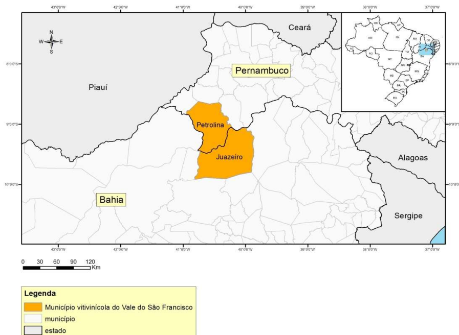
Figura 4: Mapa de Geolocalización del Vale de São Francisco

Geógrafo responsable Florin-Alexandru Enia (2018)