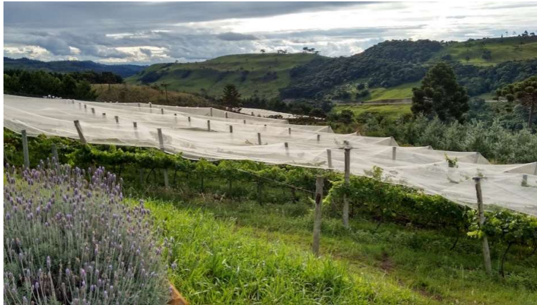
Figura 7: Paisaje del viñedo de São Joaquim