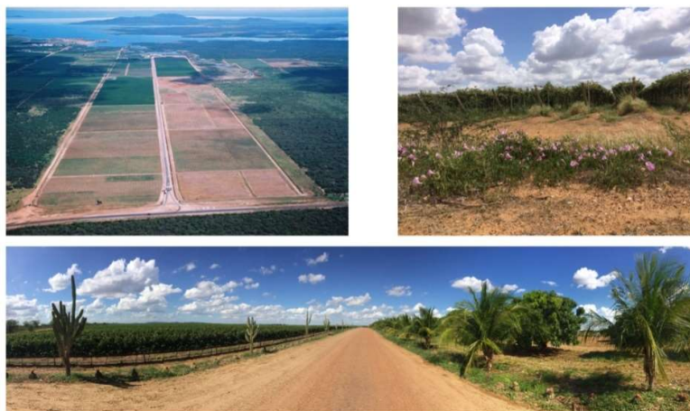
Figura 5: Paisaje del viñedo del Vale do São Francisco

vitivinicultura corporativa instalada en grandes haciendas, de gran escala productiva y verticalidad de relaciones laborales, cuyo cuerpo técnico está formado por enólogos y agrónomos del sur de Brasil.