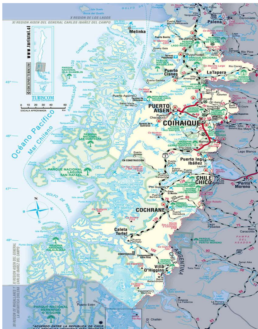
Figura 2: Región de Aysén