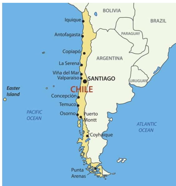
Figura 1: Mapa de Chile