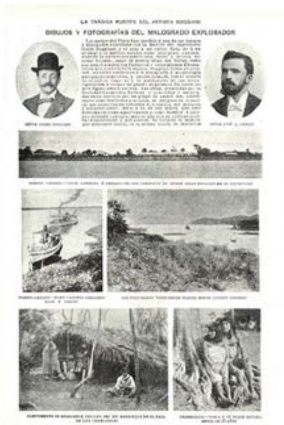
Figura 2. La muerte de Guido Boggiani en la prensa.

Frič y Fričová, 2012). La muerte de Boggiani causó estupor en el espacio científico: diarios y revistas de todo el mundo publicaron lo ocurrido, de forma más o menos sensacionalista. En Argentina, por ejemplo, Caras y Caretas le dedicó varias páginas, colmadas de fotografías tomadas por el explorador. También se divulgó una imagen de su persona y de Cancio (Figura 2).