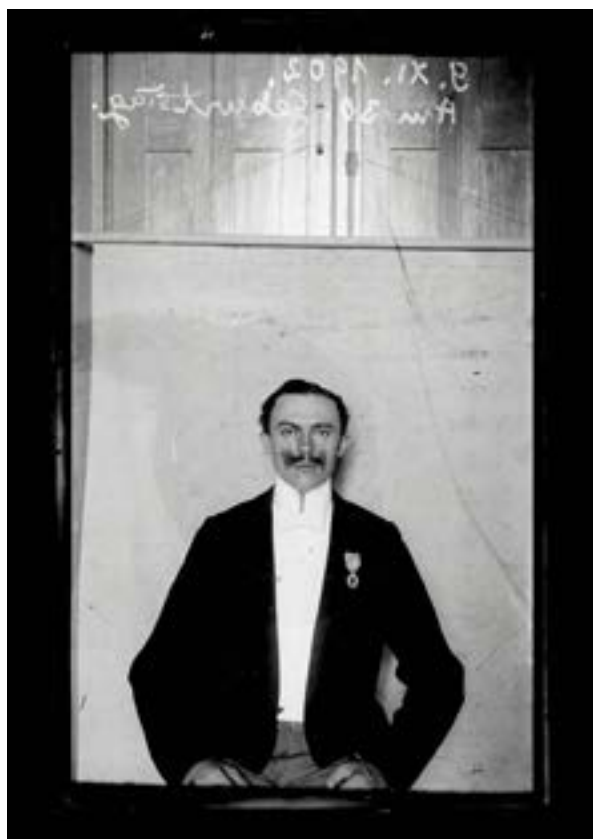
Figura 3. Robert Lehmann-Nitsche

Por su parte, Alberto Vojtěch Frič fue un naturalista amateur que devino en explorador y etnógrafo. Nació en Praga, Checoslovaquia, el 8 de septiembre de 1882, en el seno de una reconocida familia entre cuyos miembros había científicos, políticos y revolucionarios. Desde muy joven comenzó a interesarse por las ciencias naturales. Con tan solo 20 años realizó su primer viaje a Sudamérica, donde visitó las principales ciudades de Brasil y se internó en el Matto Grosso. En este primer viaje se enfocó en la botánica, especialmente en el