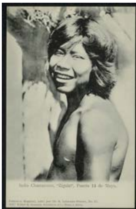
Figura 4. “Indio Chamacoco, ‘Ziguizi’, Puerto 14 de Mayo”

18. Vale la pena mencionar que el formato de este atlas no se asemeja al resto de los trabajos de este tipo publicados por Lehmann-Nitsche y cuyas fotografías son, o bien de su propia autoría, o tomadas junto a Carlos Bruch. Véase Lehmann-Nitsche (1904a, 1907) y Dávila (2014).