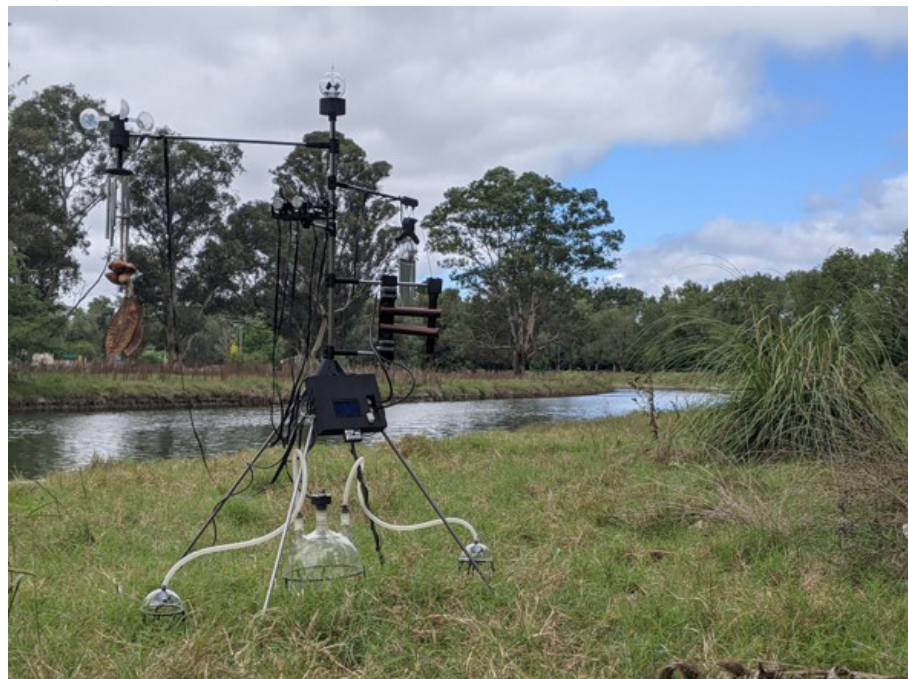
Figura 3. Terrafonías: una máquina de parentescos, Electrobiota (2021).

Hay presentes, empero, otras resonancias, que nos hacen intuir un leve desajuste de este paisaje sonoro. En un primer momento nos vemos en el territorio de la naturaleza. Pero al rato notamos otros sonidos: golpecitos titubeantes, tintineos ligeros, el tañido de lo que pareciera es un xilofón. Comenzamos a sospechar que el territorio de nuestras percepciones no se deja definir tan claramente: seguimos adentrándonos en la experiencia y descubrimos que, en una pequeña pantalla azul, se grafican valores de capacitancia, humedad, temperatura ambiente y de CO2. De pronto, saltan a la vista instrumentos de laboratorio, cables, tubos translúcidos, hélices de un anemómetro, pero también y en simultáneo, palillos, chas-chas, 7 llamadores de viento, y una hoja verde que, agitada por el viento, pone en movimiento un mecanismo misterioso, que difícilmente podría ser comprendido del todo en un primer encuentro (Figura 3).