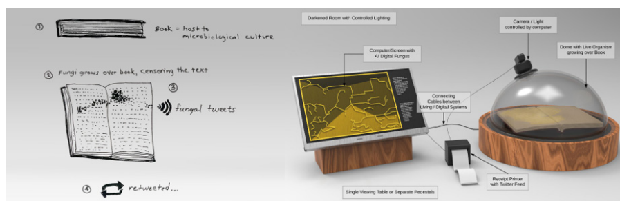
Figura 9. Degenerative Cultures , Cesar & Lois (2018).

Otro modo de trazar relaciones y especulaciones aparece en la obra Degenerative cultures , de Cesar & Lois. 12 En este proyecto cofabulan entes bióticos con una inteligencia artificial: microorganismos fúngicos crecen y se alimentan de libros que documentan la vocación humana por manipular la naturaleza, en un proceso de cooperación con una inteligencia artificial que recopila textos similares de la web y los degrada a partir de los patrones de crecimiento de los microorganismos. La obra cuestiona el paradigma científico hegemónico, generando relaciones de cooperación entre agentes humanos y no humanos, así como interacciones entre espacios heterogéneos (físicos y virtuales) (Figura 9).