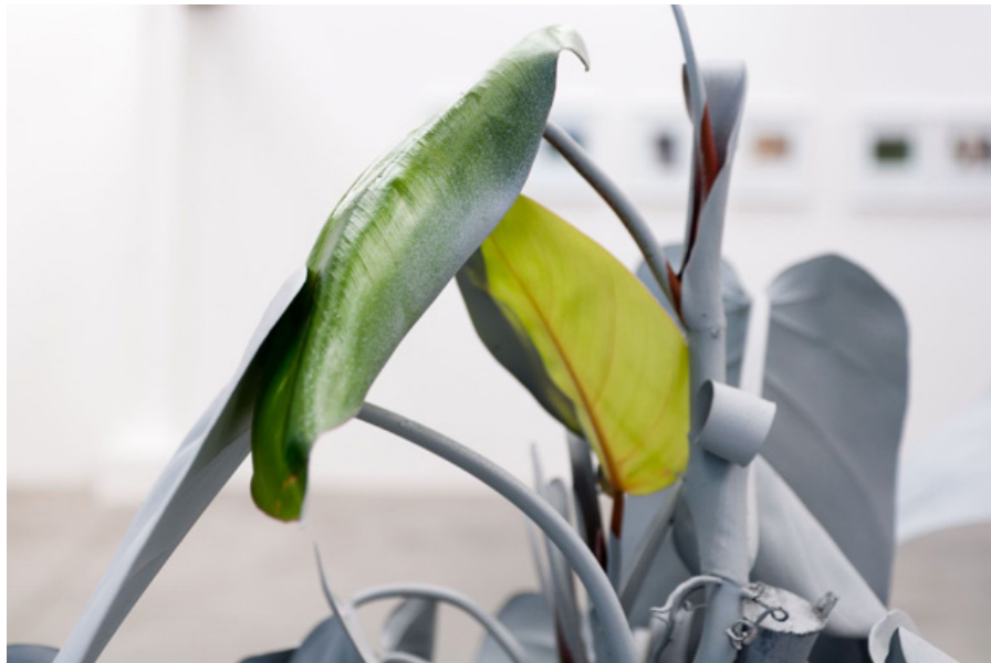
Figura 2. Herencia, Marlon de Azambuja (2016).

Otro ejemplo es Plant sounds , de Tomu Tomu, donde electrodos colocados en las hojas de las plantas registran variaciones eléctricas que se traducen en patrones sonoros. A primera vista, parece ser un ejemplo de diálogo interespecífico, pero esta práctica se ha convertido en un producto comercial a través del dispositivo PlantWave , 5 que permite “escuchar la música de las plantas” como medio de relajación. Lo que comenzó como una exploración artística se transformó en un bien transable, lo que diluye así su potencial de interrogar la relación humano-planta.