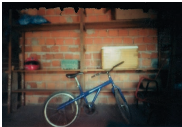
Imagem 12 - GABRIEL, William. ["A bicicleta"]. 1 fotografia, color/pinhole. 2011. 5,01cm x 7cm.