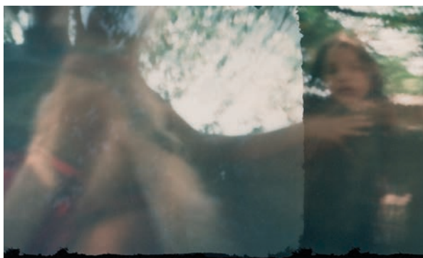
Imagem 05 - LUIS, Jonathan. [“A menina”]. 1 fotografia, color/pinhole, 2011. 5,01cm x 7cm.