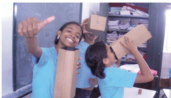
Imagem 01 - BAÍÁ, Deylane. [Observação da câmara escura, formato "caixa mágica"]. 2011. 1 fotografia, color/digital, 8,96cm x 15,91cm.

forma, "domesticado" pelos estudantes. Além disso, eles percebem que as cestas tomariam as dimensões do próprio artesão, visto que eles estavam de joelhos no chão e os movimentos mais requeridos eram os do joelho para cima. Este aspecto nos lembra as dobraduras feitas durante a construção da câmara escura, que eram sempre medidas a partir do tamanho dos dedos de quem estava dobrando. A caixa, portanto, teria que ser iniciada e finalizada pela mesma pessoa, sob pena de as duas caixas ficarem do mesmo tamanho e, assim, a visualização através do papel vegetal ser inviabilizada (Ingold e Lucas, 2007).