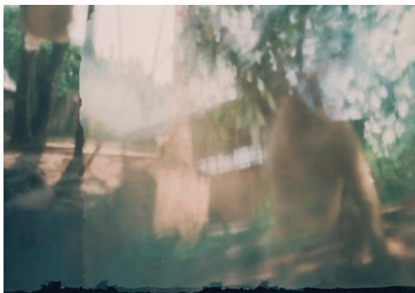
Imagem 03 - LUIS, Jonathan. [“A cadela do Jonathan”]. 1 fotografia, color/pinhole, 2011. 5,13cm x 7cm.