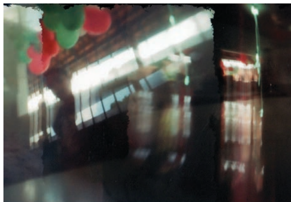
Imagem 08 - HEITOR. [“A festinha”]. 1 fotografia, color/pinhole. 2011. 5,01cm x 6,95cm