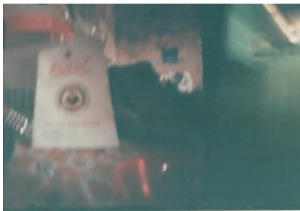
Imagem 06: LUIS, Jonathan. [“O diploma do PROERD”]. 1 fotografia, color/pinhole. 2011. 5,01cm x 7,02cm.

Basicamente, o programa consiste em lições feitas nas salas de aula sobre temas como “compreendendo as consequências do uso da droga”, “como resistir às pressões do grupo”, “maneiras de dizer não às drogas e à violência”, entre outros. As atividades são facilitadas por um policial militar fardado, que no âmbito do programa é denominado “instrutor”. Para cumprir com o objetivo traçado, o PROERD procura mobilizar, além da escola e dos estudantes, as famílias do alunado, realizando reuniões prévias ao início do trabalho. 5