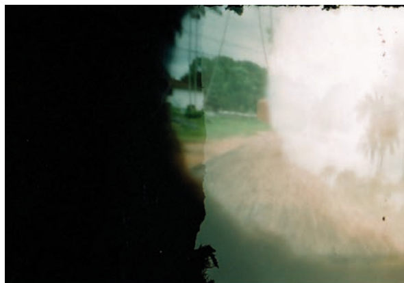
Imagem 10 - HEITOR. [“A paisagem 2”]. 1 fotografia, color./pinhole. 2011. 5,01cm x 6,95cm.

de focalizar mais árvores. Ele admirou-se em ver a imagem da copa de um açajeiro formada na camada esbranquiçada em virtude da saturação da luz durante a exposição.