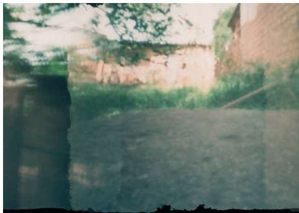
Imagem 04 - LUIS, Jonathan. [“O quintal”]. 1 fotografia, color/pinhole, 2011. 5,11cm x 6,95cm.