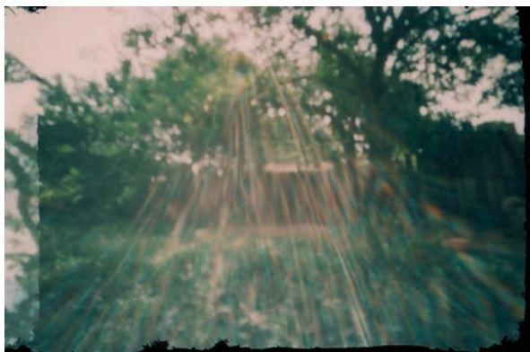
Imagem 02 - LUIS, Jonathan. ["O limoeiro"]. 1 fotografia, color/pinhole, 2011. 10,5cm x 14,81cm.

às quatro horas da tarde. Para ele, o que chama a atenção na fotografia é a sobreposição, algo característico das fotografias pinhole , pois no momento da conversão nem sempre temos a habilidade de realizar um giro perfeito. Desse modo, se o giro não é suficiente para que a bobina role e uma nova chapa apareça, as imagens acabam se sobrepondo. Segundo o Jonathan, a imagem que está sobreposta — ou justaposta dependendo do ângulo de observação — é o mesmo limoeiro. Os raios de luz que descem do céu também o encantam, parecendo fios coloridos que perfazem o mistério desse formato de produção de imagens.