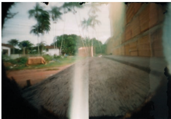
Imagem 09 - HEITOR. [“Paisagem”]. Heitor. 1 fotografia, color./pinhole. 2011. 5cm x 6,93cm