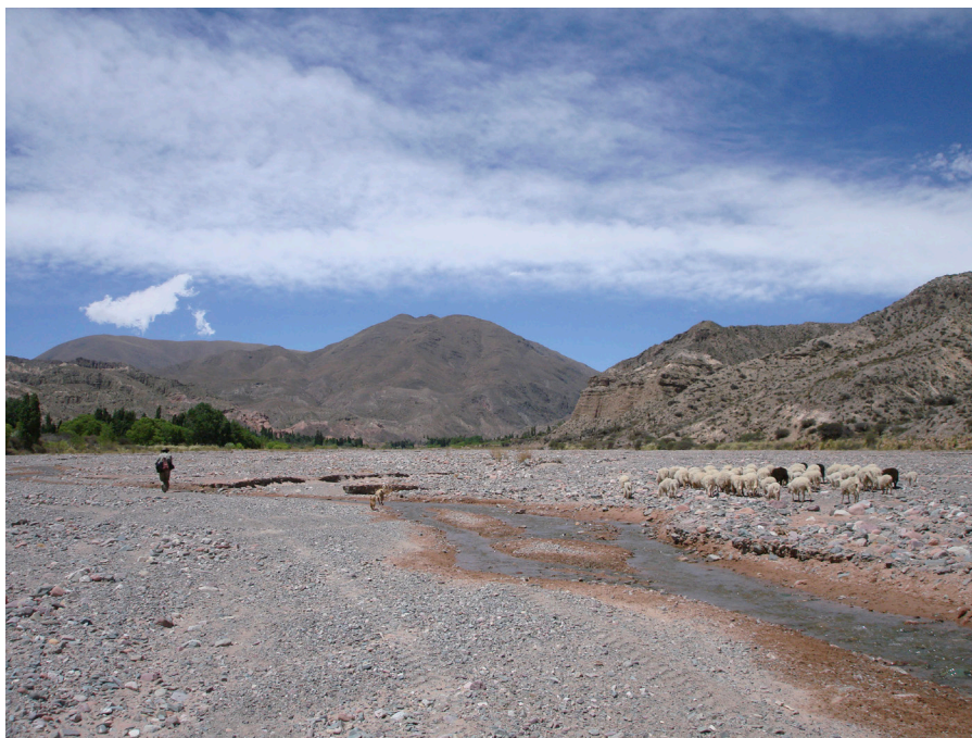
Figura 2. Ubicación: Dentro del apartado “Caminar juntos”. Guiando a las ovejas por la playa hacia el rastrojo.

que fueron el día anterior. Diversos autores (Dransart, 2002; Göbel, 2008; Elizaga, 2010 y Bugallo y Tomasi, 2012) han señalado este hablar a los animales como el resultado de la cohabitación íntima –tanto espacial como temporal– que involucra a estos con su pastor y lo han analizado como una expresión más de la antropomorfización que se hace de los rebaños domésticos en la región andina. Pero, para los pastores entrevistados, el hablar a los animales tiene, además, otras connotaciones, ya que sería otro modo mediante el cual estos pueden reconocerlo, darse cuenta del cariño que siente por ellos y de su estado de ánimo, factores que, a su vez, condicionan el comportamiento del rebaño ese día. Los animales percibirían esto a partir del aliento que emana del pastor, mediante una capacidad que los pastores definen como “instintiva”. Según un pastor ocumazeño: