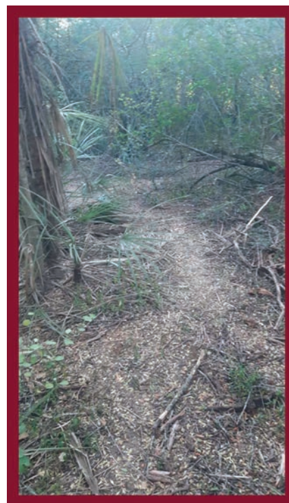
Figura 3. Sendas abiertas del monte.