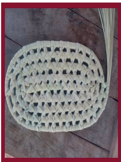
Figura 5. Base de cestería sin nudo y tejido abierto.

En todos los casos, el tejido de las piezas comienza por la base. Si la forma de la artesanía es redonda, la pieza se inicia con un nudo y, a partir de allí, se teje. Si la pieza es ovalada, se inicia el trenzado sin nudo. Hay piezas que combinan las dos técnicas y conforman entonces un tejido mixto (figura 6).