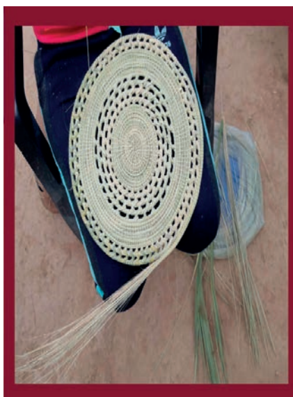
Figura 6. Pieza con nudo inicial y técnica mixta.

La comercialización de la cestería es concebida como una de las fuentes de ingreso del grupo doméstico, y su elaboración es asumida como un trabajo, en tanto constituye la fuente de ingreso de mayor importancia de las mujeres. Tal como refieren las artesanas: “Estamos con este trabajo de la artesanía [...] Las mujeres se interesaron en vender”