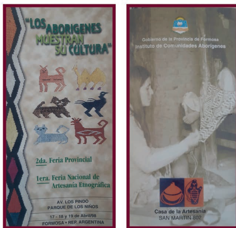
Figura 8. Folleto “Los aborígenes muestran su cultura”. Casa de las Artesanía.

nivel nacional. En particular en la provincia de Formosa, en este momento histórico identifico una demanda de producciones artesanales ligadas a “lo etnográfico”, lo “tradicional” y lo “auténtico”. Si bien esto, en la esfera de las políticas culturales, puede leerse en sintonía con el informe de la Comisión Mundial de Cultura y Desarrollo “Nuestra Diversidad Creativa” (1996), lo cierto es que la tendencia por el mantenimiento de criterios relacionados con lo “auténtico” y lo “etnográfico” es una constante en la provincia (como se detalló anteriormente). En esta línea, en octubre de 1997 se desarrolló la Primera Feria Provincial; y en abril del año 1998, la Primera Feria Nacional de Artesanía Etnográfica y la Segunda Feria Provincial, con participación de las producciones pilagá de siete comunidades particulares: Campo del Cielo, El Carandillar (o Km 14), La Bomba, Juan Bautista Alberdi, Pozo del Tigre, Ibarreta y San Martín 2. Los folletos de la primera y la segunda feria provincial repiten la misma frase: “Los aborígenes muestran su cultura” (figura 8). En este caso, es una cultura diferencial, que se propone inmutable, y en tanto tal, auténtica. La producción cesteril, hasta ese entonces, estaba compuesta por diversas piezas de carácter utilitario y diseño no figurativo, tales como posapavas, portatermos, canastas, paneras, costureros con o sin tapa y cilindros con forma de vaso de diversos tamaños.