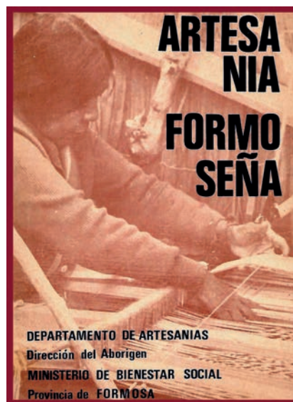
Figura 7. Publicación “Artesanía Formoseña”, del Departamento de Artesanías de la entonces Dirección del Aborigen (1977).

En la mencionada publicación, se mapean y describen las diversas producciones de los tres pueblos indígenas reconocidos como habitantes de la provincia, y estas consisten en “tejeduría”, “alfarería” y “talla en madera”. Cuando se refiere a la tejeduría, en el apartado “Materia prima”, especifica que se refiere a la elaboración con “fibras de las bromeliáceas, y en particular a dos especies: el chaguar ( Bromelia Serra ) o caraguatá, y la ivira ( Pseudoananás Macrodon )” (p. 9). De este modo, se descarta que, bajo el título de tejeduría, se esté haciendo referencia al tejido cesterero.