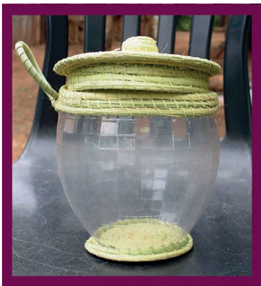
Figura 9. Artesanía combinada (2011). Artesana: Delia Quiroga.

En segundo lugar, las producciones cesteras incorporan, en función de pedidos explícitos, diseños figurativos. Surgen en esa época elaboraciones de costureros y alhajeros en carandillo con diseños zoomorfos —en cuyas tapas se replican pequeños pájaros, patos, conejos, tortugas y perros— y colgantes con forma de pájaro. Se abonaba, a partir de estas producciones, la connotación de que las artesanas y —como sinécdoque— el pueblo pilagá, estaban en profunda conexión con la naturaleza, lo que refuerza parte del imaginario atribuido a los pueblos indígenas en tanto ecólogos por antonomasia. También en aquel entonces se registraron, dentro del abanico de piezas producidas, muñecos con la camiseta de los dos equipos de fútbol argentinos más populares y sombreros (Spadafora y Matarrese, 2010).