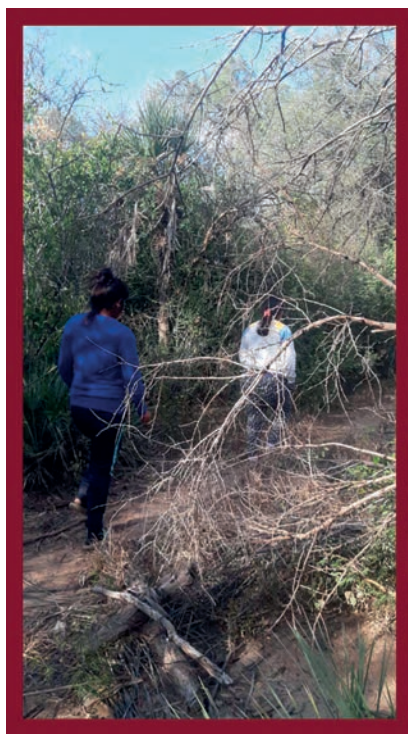
Figura 2. Adentrándose en zonas más densas en la espesura del monte.