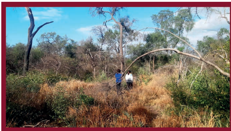
Figura 1. Delia y Alejandra caminando hacia el monte en la comunidad rural Laqtasatanyie .

La materia prima es recolectada por las pilagá durante sus recorridos por el monte (figura 1). Estas caminatas se desarrollan en grupo y requieren de unas tres o cuatro horas, dependiendo de la lejanía con respecto a los carandillares. Los recorridos varían según las comunidades. Por ejemplo, en las comunidades periurbanas de Ayo La Bomba o Qom pi no se encuentra más carandillo (con hojas largas y en buen estado para la confección artesanal), y en las comunidades rurales, las hojas más requeridas se obtienen internándose en lo más espeso del monte (figura 2 y 3), dentro de los territorios comunales, 2 cuyo uso es irrestricto y exclusivo para sus miembros. Las mujeres, en sus recorridos más cortos, son acompañadas por sus hijas e hijos pequeños (Matarrese, 2013).