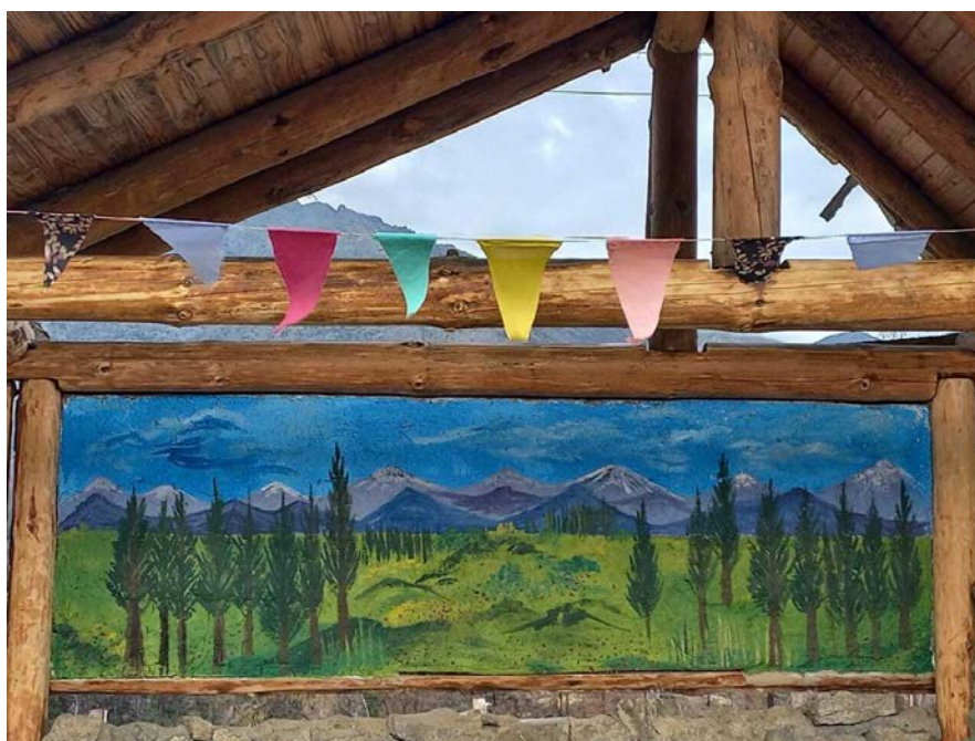
Figura 5. Mural de La Garita, El Pinar

La artista siente que la obra fue “comunitaria”, ya que entre la ayuda para preparar la superficie, la solicitud, los mates y el acompañamiento, no puede adjudicárselo como propio. Define su obra como