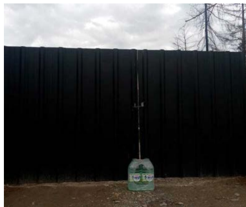
Figura 4. El agua para el pinar después del incendio.

Fotografiaron lo que era su día a día, relata, y las injusticias que se les presentaban cuando iban a realizar los reclamos en los organismos oficiales para que se les restituyera el servicio de agua. Fueron guardando las imágenes, hasta que decidieron imprimirlas y mostrarlas, por primera vez, en el marco de los “Festivales del Bosque en Defensa del Agua 2022”, la forma en que ante la situación se renombró en 2022 a la típica “Fiesta del Bosque y su entorno” de Lago Puelo. Para ella era una vergüenza que, de todos modos, se hiciera la fiesta. Y entonces decidieron llevar sus fotos para mostrar lo que sucedía en los bosques sin agua.