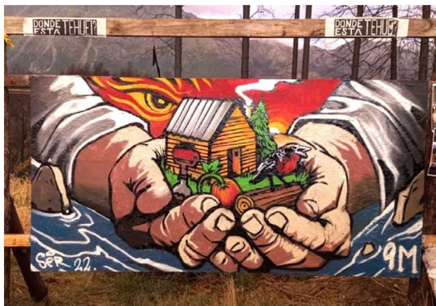
Figura 7. Agua para los barrios

En “Agua para los barrios” el título de su mural, Reyes refirió que no quiso pintar el incendio porque entendía que eso se veía por sí mismo; era redundar en imágenes. En cambio, prefirió plasmar