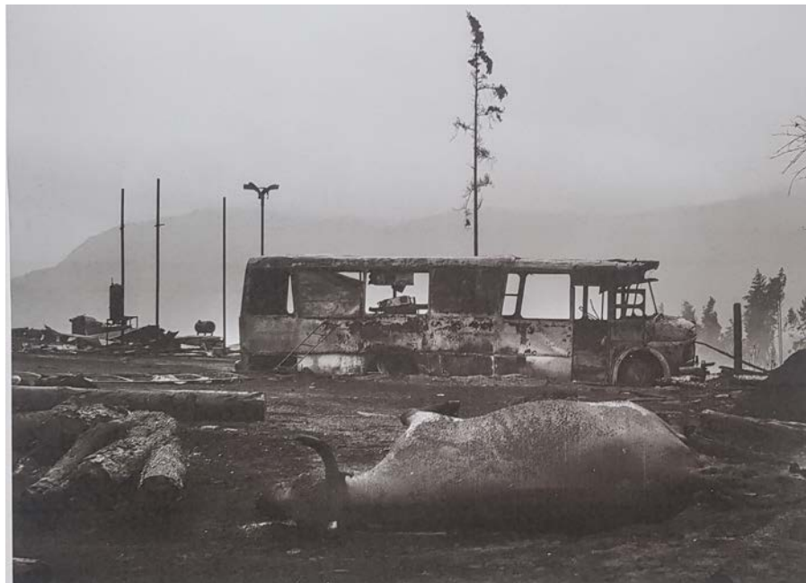
Figura 1: Interfase