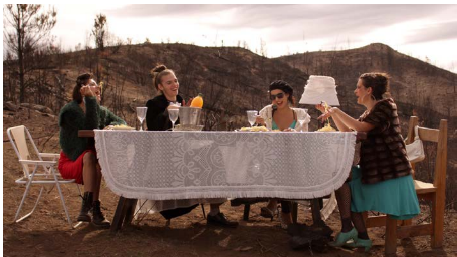
Figura 3. Riquezas

La obra comenzó siendo expuesta de forma virtual en la red social Instagram 9 en el mes de junio, bajo el título “De tragedias y craquelados”. Tal modalidad, junto con las postales, fue escogida en función de obtener circulación y alcance más allá del ámbito local. En este apartado nos centraremos en “Riquezas”.