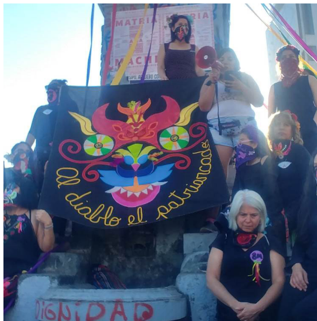
Imagen 6. Arpillera "Al diablo el patriarcado" (Barrientos, 2020).

Durante el proceso creativo colectivo de las arpilleras, cada bordadora asume un rol, que puede ser, cortar las telas, hilvanar las piezas, coser y bordar, aplicar accesorios y realizar las terminaciones de la pieza (bordes y amarras). Sumado a este trabajo de orden manual, se encuentra todo un quehacer de gestión del colectivo, el cual posibilita la realización de todas las actividades programadas por la agrupación, y posibilita que en la actualidad, dos de sus integrantes puedan vivir de esta actividad, percibiendo una remuneración por sus labores. Para ello, Memorarte crea estrategias de financiamiento, tanto desde la autogestión como desde el establecimiento de vínculos con otros organismos, públicos y privados.