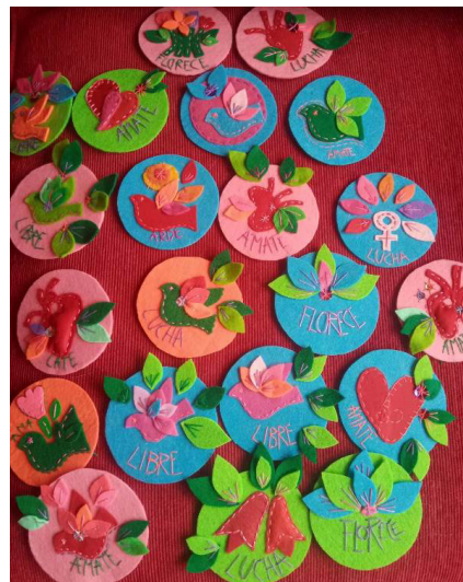
Imagen 1 y 2. Pines serie “Amarse es florecer” y “Yo decido”.