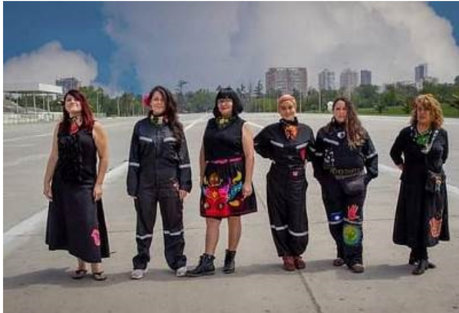
Imagen 9. Indumentarias de Memorarte para su actuación en la calle.

Dependiendo de la ocasión, el atuendo se conforma de vestidos o faldas negras u overoles, 21 con aplicaciones bordadas como muestra la imagen 9. El uso de overoles aparece generalmente, cuando Memorarte acude a las protestas, pues les permite una mejor movilidad en situaciones conflictivas o de riesgo una vez que la policía reprime a los manifestantes. Así mismo, esta indumentaria es una referencia a las y los trabajadores, colocando la idea de que bordar es también un trabajo arduo y, a la vez, contestatario. Ambas vestimentas son acompañadas de accesorios como pañoletas bordadas que llevan en el cuello y tocados de flores en el pelo.