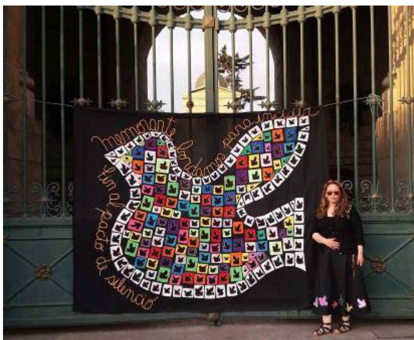
Imagen 12. Arpillera “Paloma ausente” en las afueras del cementerio general de Santiago, lugar donde finaliza la marcha cada año.