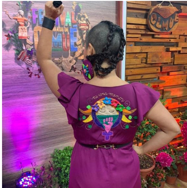
Imagen 5. Intervención de vestuario de la cantora chilena "La Chinganera".