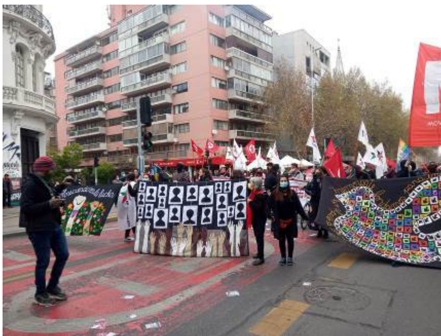
Imagen 11. Participación de Memorarte en la marcha por la Alameda en conmemoración del 11 de septiembre.