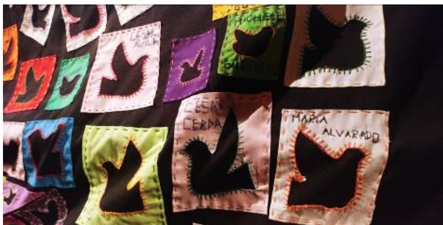
Imagen 13. Detalle de la pieza "Paloma Ausente" registro realizado durante el I Encuentro de Arte textil y Resistencia (Barrientos, 2018).

Una construcción que se desarrolla a partir, de la apropiación de esta obra por acción de los propios familiares de las víctimas, quienes han intervenido la obra bordando en cada cuadradito de tela, el nombre de aquellos ausentados forzosamente, creando una especie de memorial itinerante. Ver el detalle de esta pieza en la imagen 13.