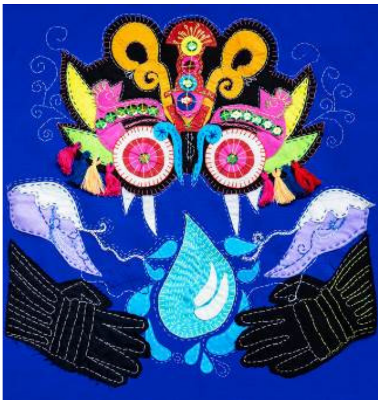
Imagen 4. Arpillera "Suelta el agua acaparador neoliberal" 15.

Y, un tercero son los lienzos de gran tamaño, los cuales tienen como fin su exhibición en la calle. Las composiciones que se plasman en este formato requieren de un lenguaje visual claro y directo, conformado de símbolos reconocibles, colores vibrantes, menor cantidad de detalles de bordado y textos breves. Elementos que permiten que las obras sean visualizadas y leídas fácilmente, por quienes transitan en la vía pública, una de las obras de mayor reconocimiento por el público es la arpillera titulada "Al diablo con el patriarcado" (imagen 6), la cual acompaña al colectivo en cada marcha convocada por los movimientos feministas.