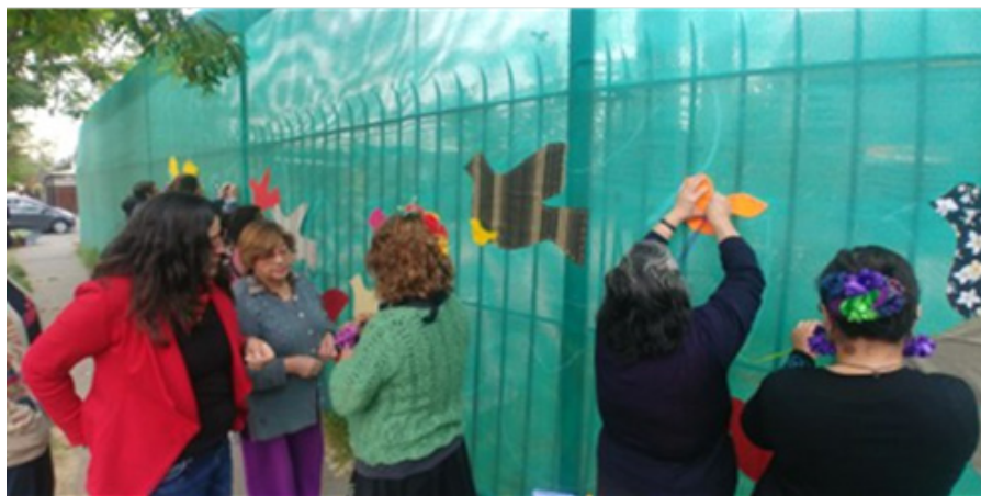
Imagen 8. Intervención textil en barrio Yarur (Barrientos, 2019)

La estética corporal es otra forma más de difusión que las arpilleristas usan en la calle, un distintivo que les posibilita llamar la atención de quienes transitan por el espacio público como manifestantes en las protestas, transeúntes, fotógrafos y quienes cubren mediáticamente dichos eventos, una manera de "atrapar el ojo para comunicar ideas", como diría Érika (2023) en un conversatorio organizado por el Observatorio de Participación Ciudadana y No Discriminación del Ministerio Secretaría General de Gobierno y el Municipio de la comuna de Pedro Aguirre Cerda.