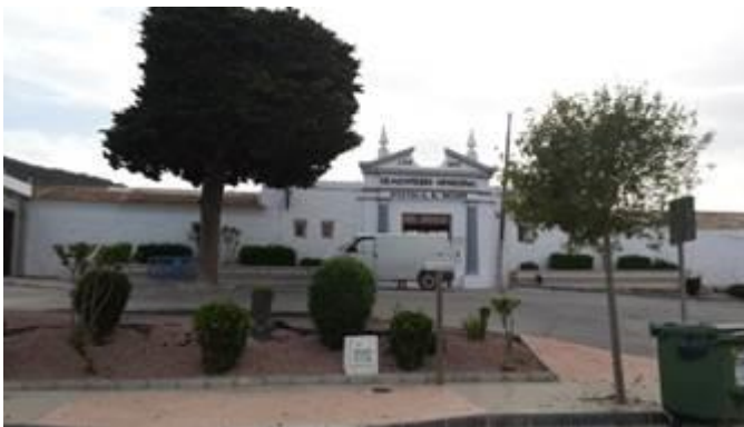
Foto 7. Edificaciones paradas frente al cementerio. Guardamar. Abril-mayo 2015.