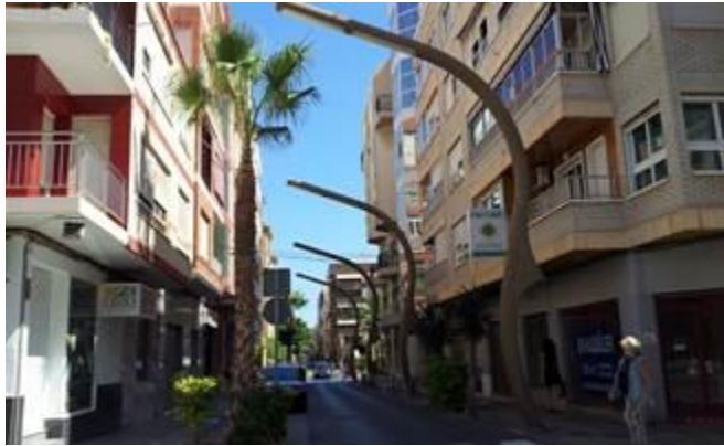
Foto 20. Calle Caballero de Rodas. Torrevieja. Octubre 2015

Fuera de estos planes también se hicieron inversiones con fondos públicos, como el auditorio de Torrevieja, un gran edificio que construyó la Sociedad Proyectos Temáticos de la Comunidad Valenciana (empresa pública de la Generalitat Valenciana), que se inauguró en el 2011, y que contó con un presupuesto de más de 40 millones de euros. Igualmente, como concesión por la construcción de la desaladora, se elaboró un Plan de Restitución a cargo del Estado que tiene previstas varias obras públicas con un valor de más de 11 millones de euros. Entre ellas destacan la creación de un paseo marítimo en el dique de Poniente y otro que una la playa de Los Náufragos con la urbanización de Mar Azul.