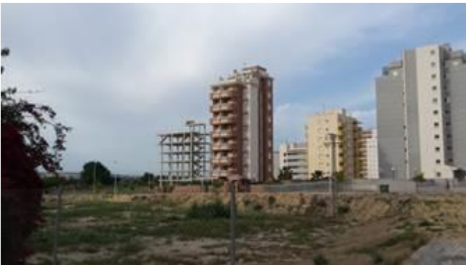
Foto 3. Guardamar del Segura, 2015