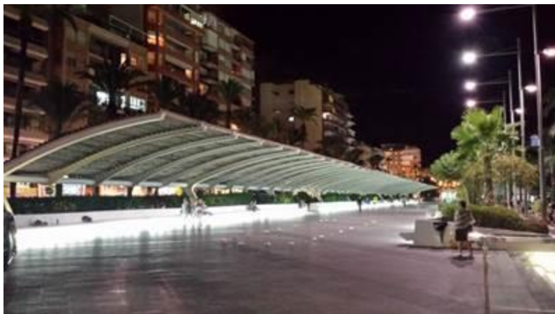
Foto 19. Paseo Vista Alegre. Torrevieja, 2015