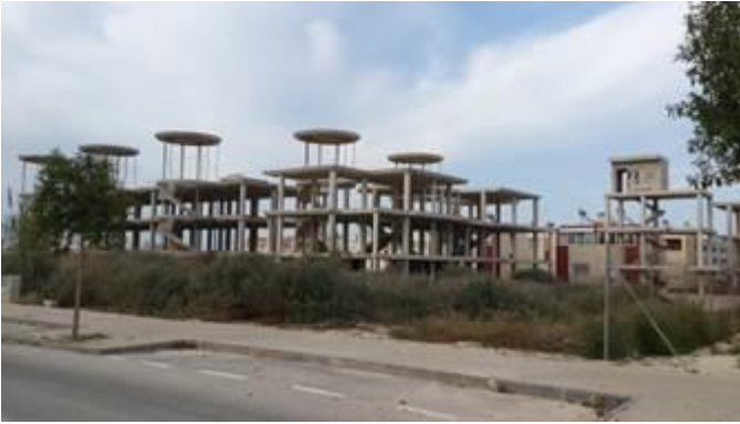
Foto 8. Edificaciones paradas frente al cementerio. Guardamar. Abril-mayo 2015.