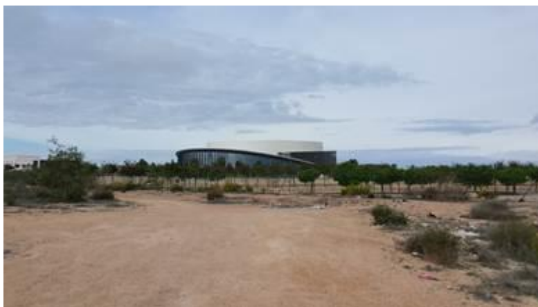
Foto 21. Auditorio. Torrevieja, 2015