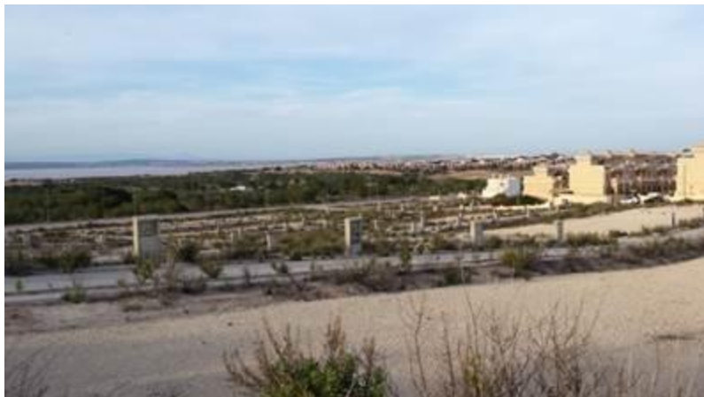
Foto 10. San Miguel de Salinas. Mayo 2015. Solar dotado de servicios sin construir, que recuerda metafóricamente a la imagen de un cementerio.

El paso del tiempo se deja sentir tanto en los descampados como en las edificaciones sin terminar, dándose nuevos elementos de ejemplificación e interpretación. El abandono y la desilusión, se perciben cuando se miran los carteles en los que se anunciaba la próxima construcción y el teléfono a llamar, presentes en algunos de estos solares. En efecto, el transcurrir de los años y las inclemencias meteorológicas acabaron derribando algunos de ellos o destrozándolos, quedando únicamente en pie sus estructuras.