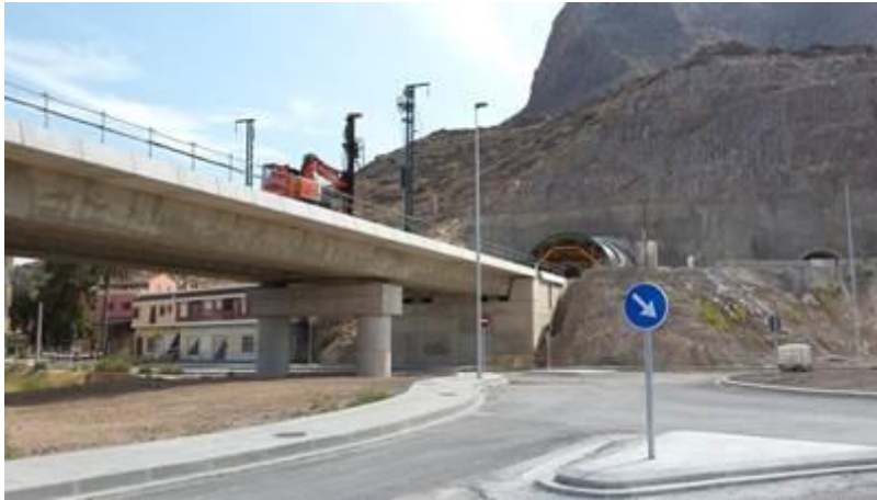
Foto 22. Trazado y obras del AVE. Callosa de Segura. Septiembre 2015