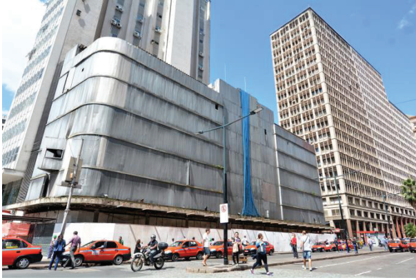
Figura 7. Edifício Guaspari e avenida Borges de Medeiros, Porto Alegre, sequência cronológica.

Figure 7. Guaspari Building and Borges de Medeiros Avenue, Porto Alegre, chronological sequence.