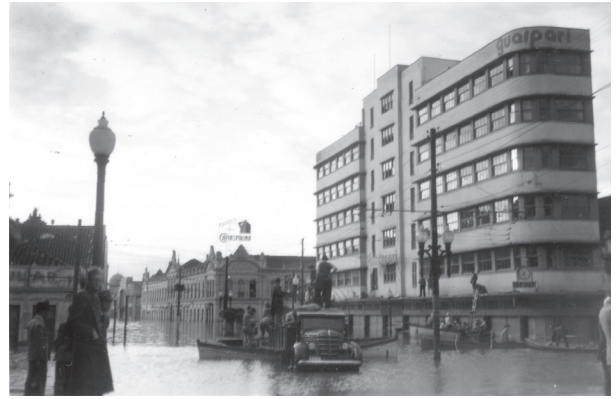
Figura 4. Edifício Guaspari e avenida Borges de Medeiros, Porto Alegre, enchente de 1941, sequência cronológica.

A estrutura de concreto é rigidamente modulada com uma linha de pilares de cinco em cinco metros, independente da parede, paralela ao alinhamento do terreno e outra linha de pilares, embutida na parede, acompanhando a inclinação do terreno em sua divisa de fundos, sendo que as vigas acompanham a malha formada pelos pilares. Os pavimentos superiores, com pequeno balanço em relação ao térreo, têm suas fachadas libertas pela estrutura independente. O pavimento térreo é conformado pelos pilares e, entre eles, os grandes panos de vidro, formando as vitrines da loja, com bandeiras abaixo da marquise, percorrendo toda a sua extensão. Esse conjunto de soluções, formado pela transparência, pelos pilares e consequente sombreamento, desperta a sensação, descrita no início deste texto, de que o edifício flutua entre o mar de pessoas e veículos (Figura 5).