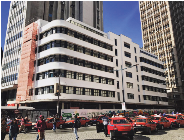
Figura 8. Edifício Guaspari e avenida Borges de Medeiros, Porto Alegre, sequência cronológica.