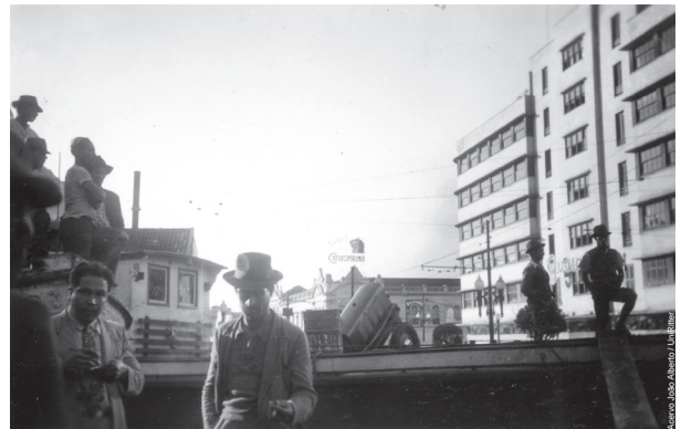
Figura 5. Edifício Guaspari e avenida Borges de Medeiros, Porto Alegre, enchente de 1941, sequência cronológica.

Figure 5. Guaspari Building and Borges de Medeiros Avenue, Porto Alegre, 1941 flood, chronological sequence.