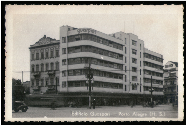
Figura 3. Edifícios Guaspari e Malakoff, Porto Alegre, Vista do Paço Municipal.

Figure 3. Guaspari and Malakoff Buildings, Porto Alegre, View of the City Hall.