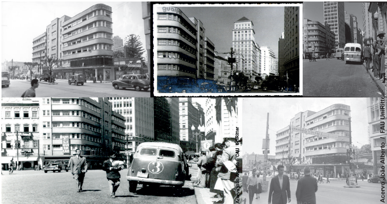
Figura 6. Edifício Guaspari e avenida Borges de Medeiros, Porto Alegre, seqüência cronológica.

Vale lembrar, para fins de conclusão, embora parcial a respeito de parte do processo trilhado pela modernidade da cidade de Porto Alegre, que o evento da Exposição