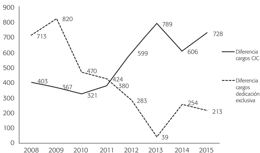
Gráfica 2 CRECIMIENTO ANUAL DE LA CANTIDAD DE INVESTIGADORES CON DEDICACIÓN EXCLUSIVA, CONICET Y UNIVERSIDADES NACIONALES 2005-2015

Fuente: Elaboración propia con datos de la Secretaría de Políticas Universitarias y el Conicet.