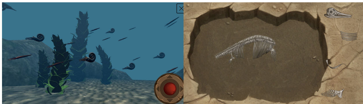
Figura 2: Escenario 360º(izquierda) y Esqueleto (derecha)

Nota: Imágenes se difunden con autorización de Games Adaone.