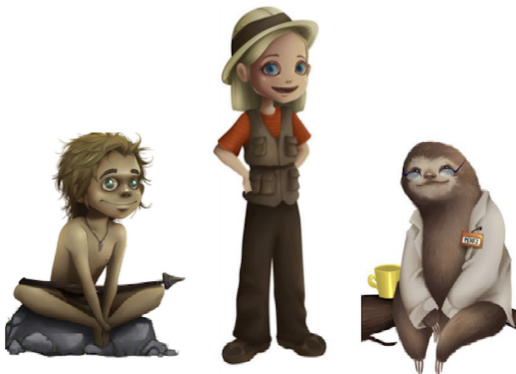
Figura 1: Representación de doctora Aning, Pérez y Neand