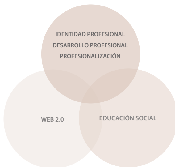
Figura 1: Diagrama de Venn aplicado a la pregunta de la investigación

Nota: Elaboración propia a partir de Hempel (2020)