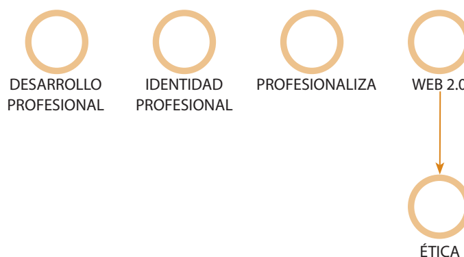
Figura 3: Sistema categorial de análisis

Para el análisis de los datos se utilizó el software NVivo 12 Versión Release 1.5. que parte de un sistema categorial previo de cuatro temáticas establecidas acorde con el objetivo de la revisión (desarrollo profesional, identidad profesional, profesionalización y web 2.0). En el análisis de los artículos emergió una subcategoría en la relativa a la Web 2.0 en relación con la ética, tal y como se aprecia en el sistema categorial definitivo (ver figura 3).