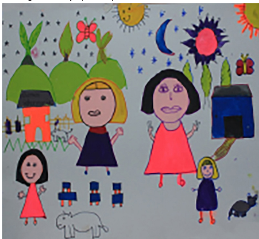
Figura 2: dibujo que hace parte del mural "Soñando en colectivo"