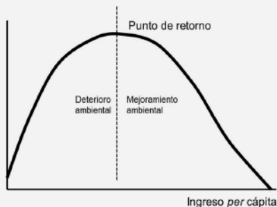
Figura 1. Curva de Kuznets de degradación medioambiental.

La degradación del medio ambiente aumenta a medida que el nivel de ingreso lo hace; esto sucede porque la economía está basada en actividades primarias (agricultura y minería, principalmente). Después, cuando la economía llega a una fase industrial, la degradación es mayor y el nivel de ingresos aumenta más, esto hasta el punto de inflexión de la curva, en el cual la economía desarrolla cada vez más actividades en servicios e industria con procesos de manejo de residuos, con base en nuevas tecnologías, manteniendo el crecimiento en el ingreso, pero con una constante caída en la degradación ambiental (Catalán, 2014) (Ver figura 1).